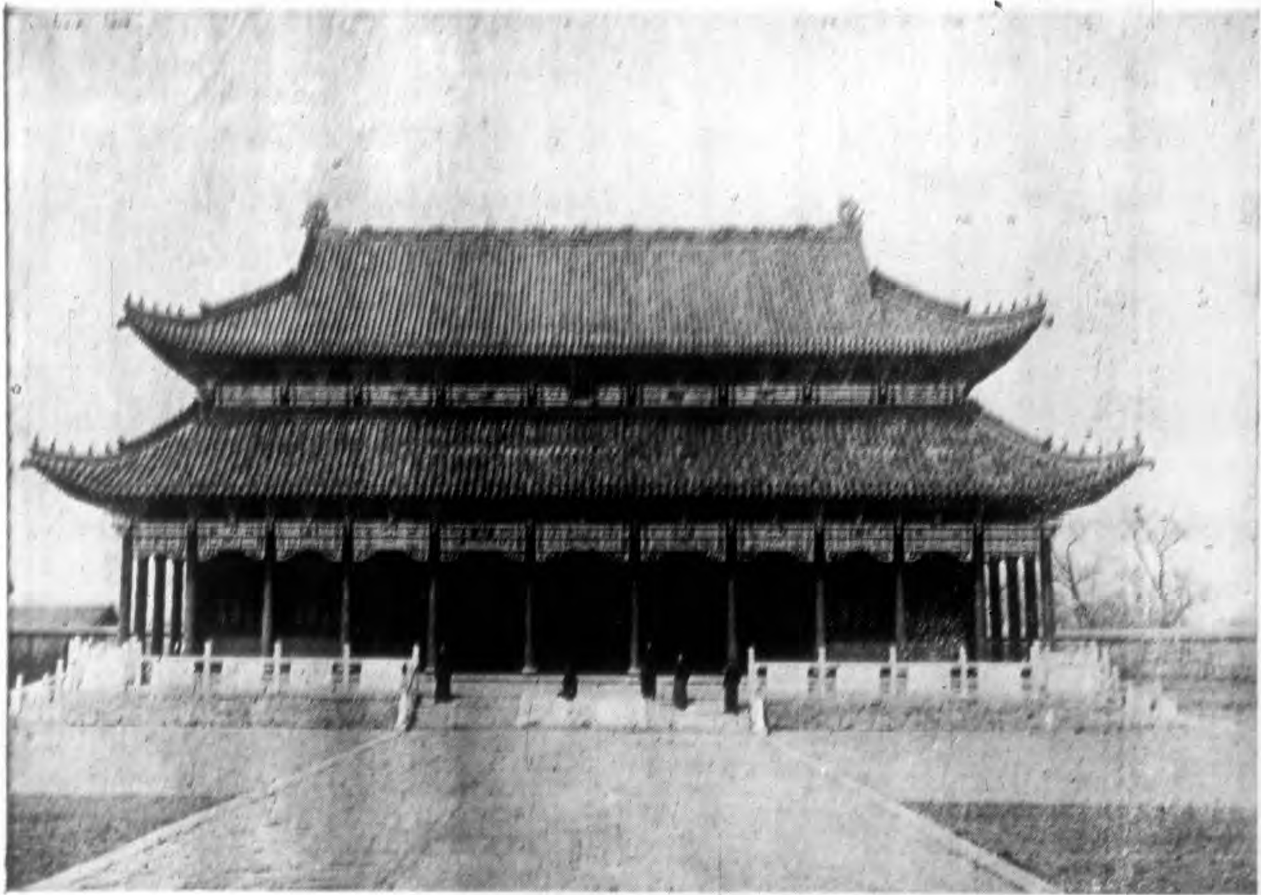
吉林孔廟之大成殿