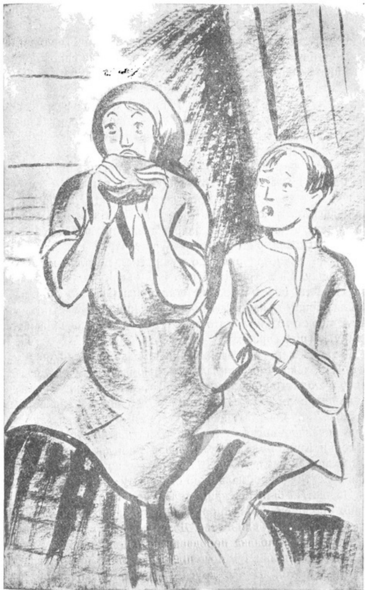
Піднесла до рота і жадібно почала їсти