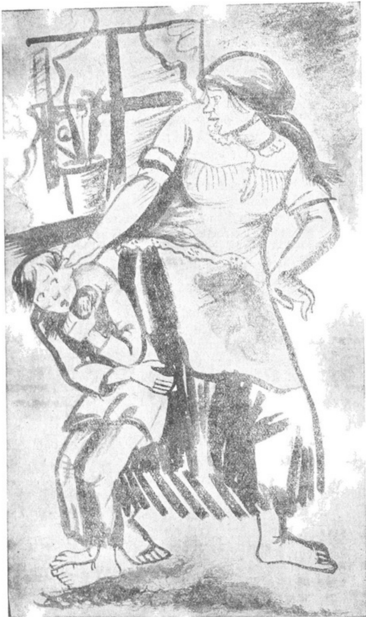
Вчепилася руками у вуха, у волосся й шосили торсонула хлопця. Тимш зрешт від болю. Крізь плач виправдувався