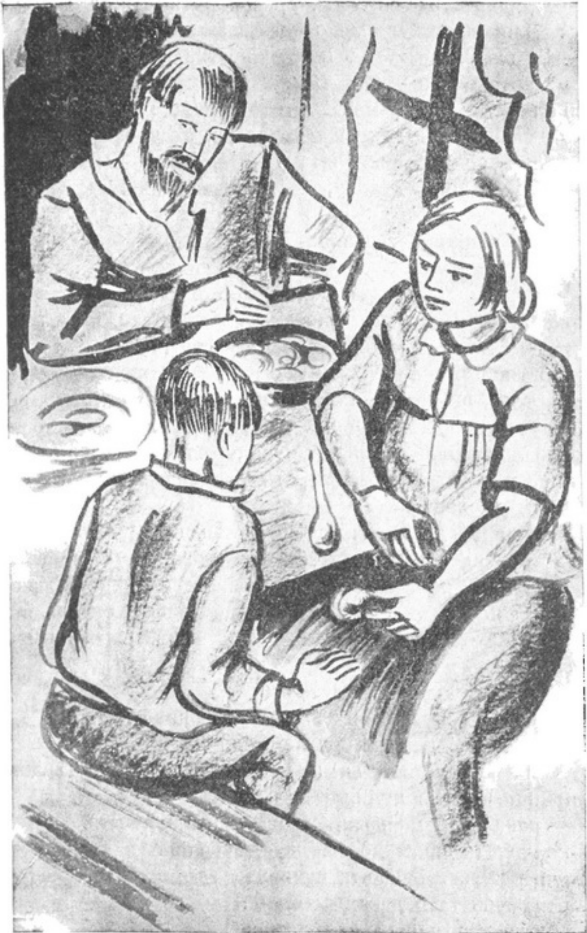
Взяла з миски картопливу, шматок риби й подала хлопцеві