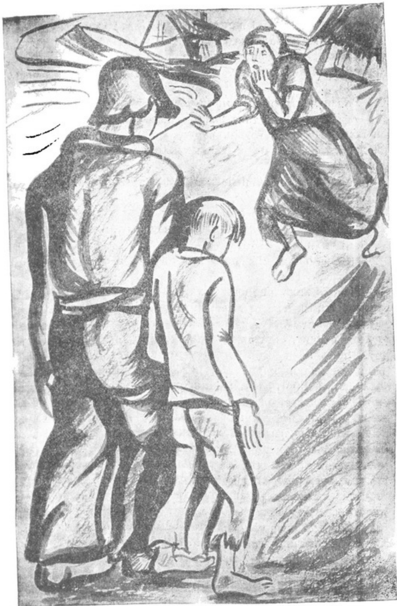
Іде хлопець, мов п'явий, хитається, і його якийсь чужий рибалка за руку веде