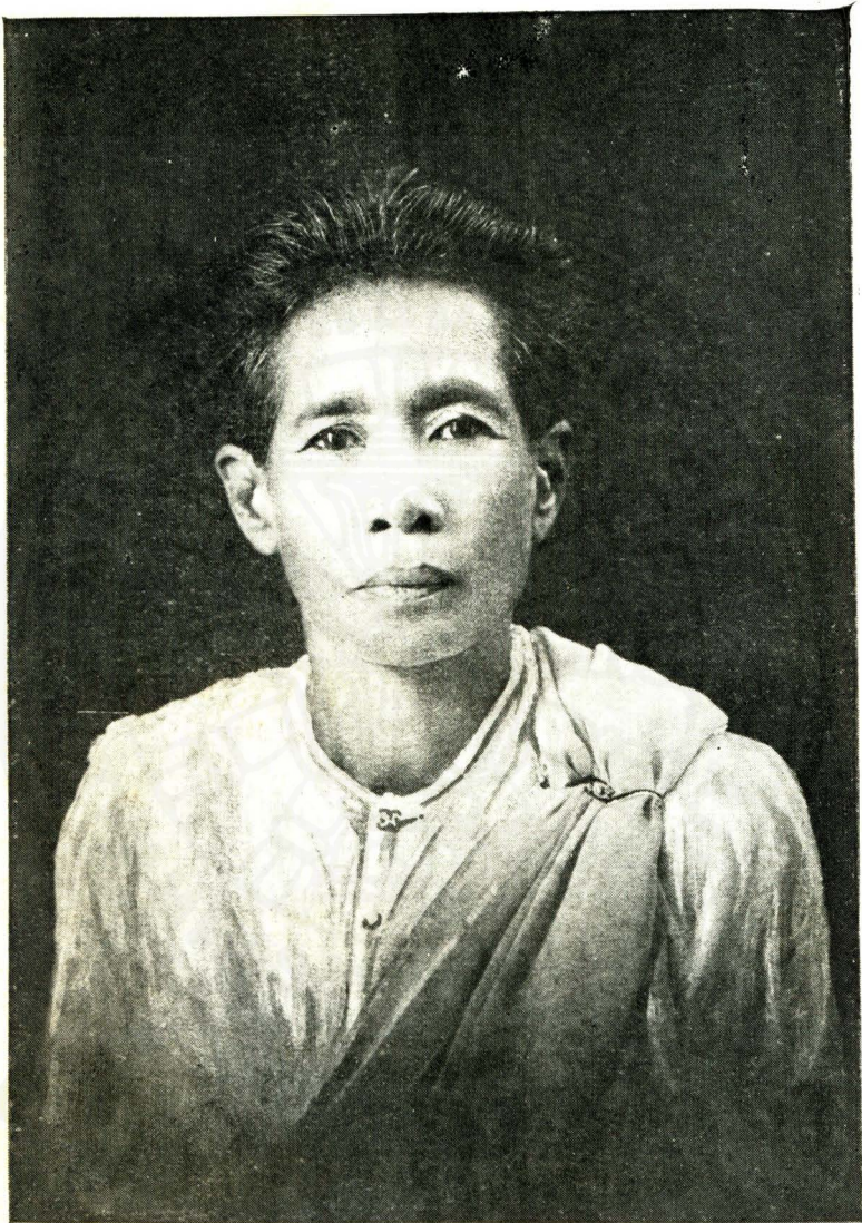
นางชนราชพินิจชัย ชวตศ พ.ศ. ๒๔๑๕ มรณะ พ.ศ. ๒๔๓๘