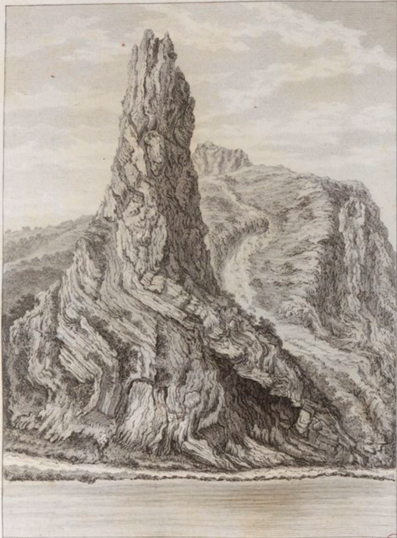
VUE DE LA ROCHE POINTU.

Desseiné par Kellin Dessiné par M. de la Roche BnF ARS Dauphiné N° 42.