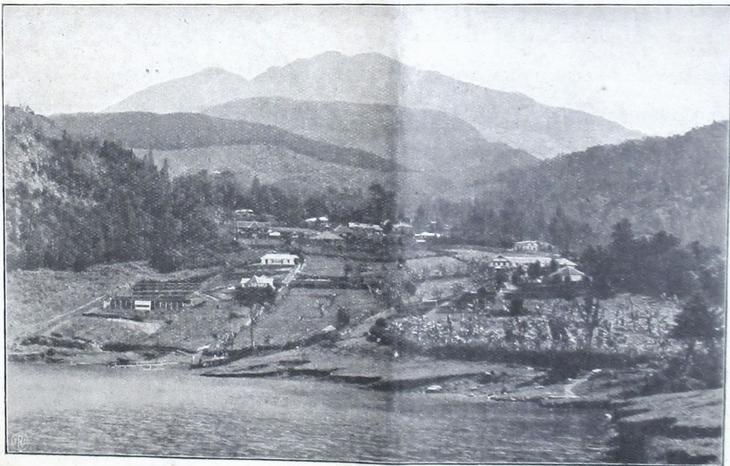
ප්‍රචාරණ මධ්‍යස්ථානයේ සිටින අයට

ප්‍රචාරණ මධ්‍යස්ථානයේ සිටින අයට මිල රුපියල් 4500 ක මිල රුපියල් 1500 ක මිල රුපියල් 1500 ක (kachel) කාමරයක් මිල රුපියල් 1500 ක මිල රුපියල් 1500 ක මිල රුපියල් 1500 ක