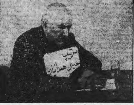
سرتیپ حسین همدانیان رئیس سابق سلاواک کرمانشاه در آخرین لحظات این ژنرال در راه دادگاه اعدام کرد که او حتی به ناخن پیکر مبارز صدمه زده است!