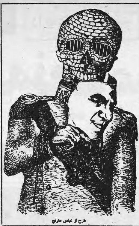
طرح از هانس سارنج

مخبره اول اسفند ۱۳۷۷ مخبره دوم اسفند ۱۳۷۷ مخبره سوم اسفند ۱۳۷۷