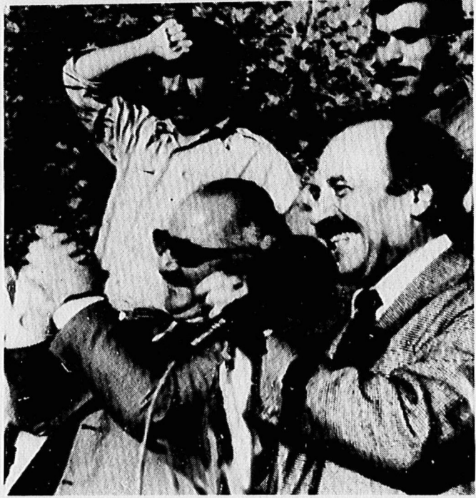
رفیق کیانوری که آمد، انبوه جمعیت از جا کنده شد. هزاران دست، مشت شده، هزاران صدا هاله یک صدا، صداها شد. صداها شور و سرود بود. صداها درود به رهبری حزب بود. در عکس رفیق نورالدین کیانوری، دبیر اول کمیته مرکزی حزب توده ایران و رفیق قلی کی شش عضو هیئت سیاسی کمیته مرکزی حزب توده ایران با بلند و مشت های بسته به نشانه اتحاد، از جمعیت سپاسگزاری می کنند.

شکوفه هایی از باغ هزار شکوفه حزب توده ایران منعات ۳