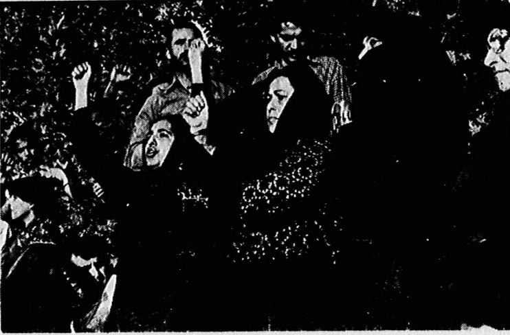
حزب شهدا، فالله در قاتله سپاه‌پوش دارد. مردانی که در خون خویش شلتیدند، تا راه توده‌ها هموار شود، پرچم مبارزه را به‌زلان، همسران و فرزندان خود دادند...