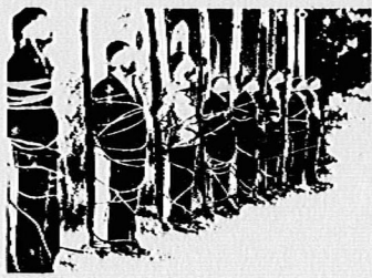
این دوشهر راهمانطور که از ناریخش پیداست، در هنگام قتل و عام افسران حزب توده ایران سروده‌ام. ۲۵ سال گذشته است. روی همان کاغذی که آنوقت نوشته بودم، میفرستم.