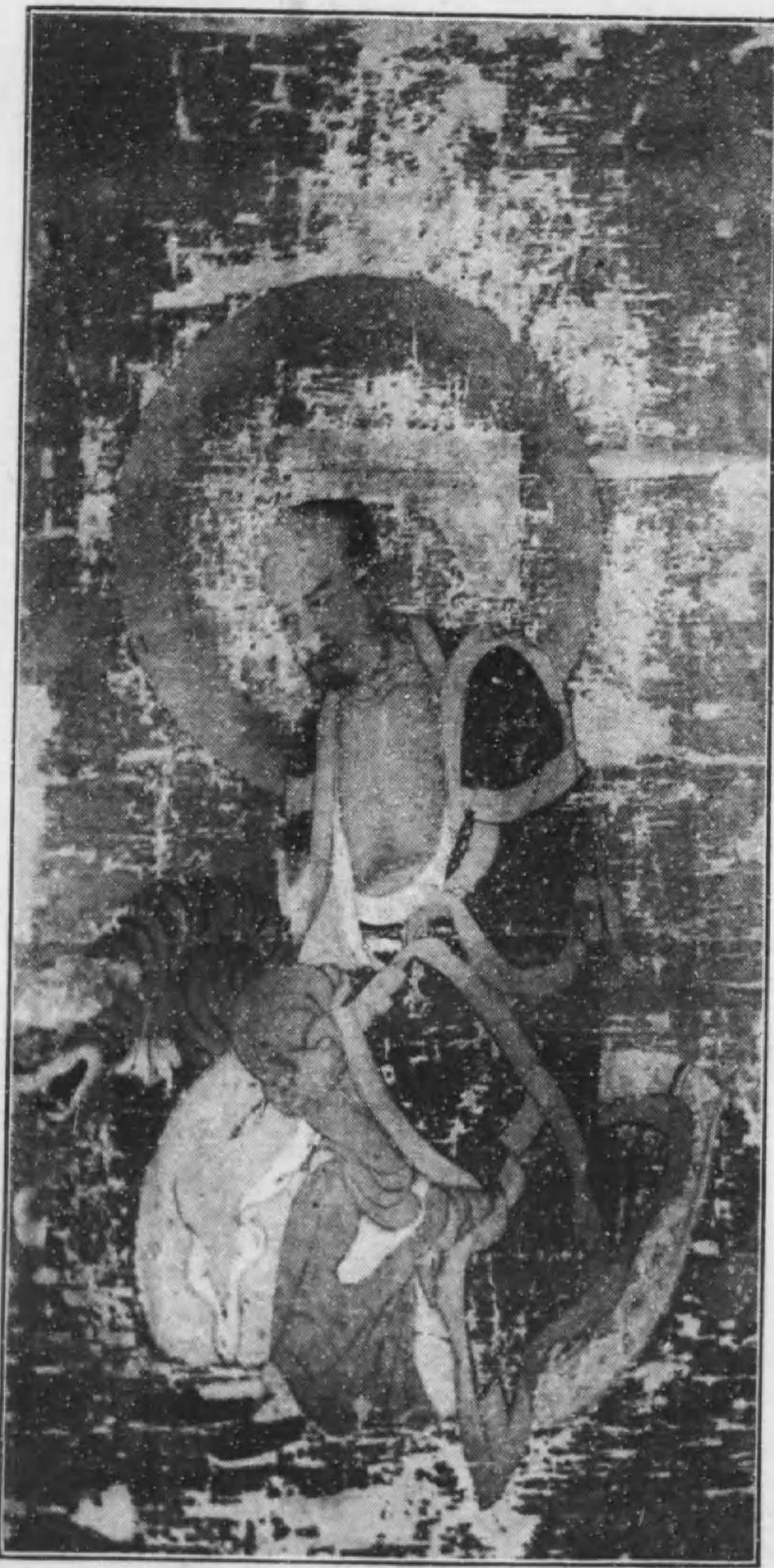
藏寺經華法 像漢羅六十

用ひて重疊の狀を強調し殆んど文様を描かない。上部絹が朽損して頭部に補筆あるは惜しむべきである。法華經寺の十六羅漢圖に至つては朽損最も甚しく、その歎識の如きも今殆