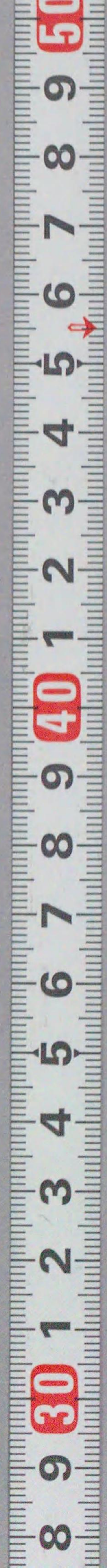
国立国会図書館 福神金大帳：2巻 207-490