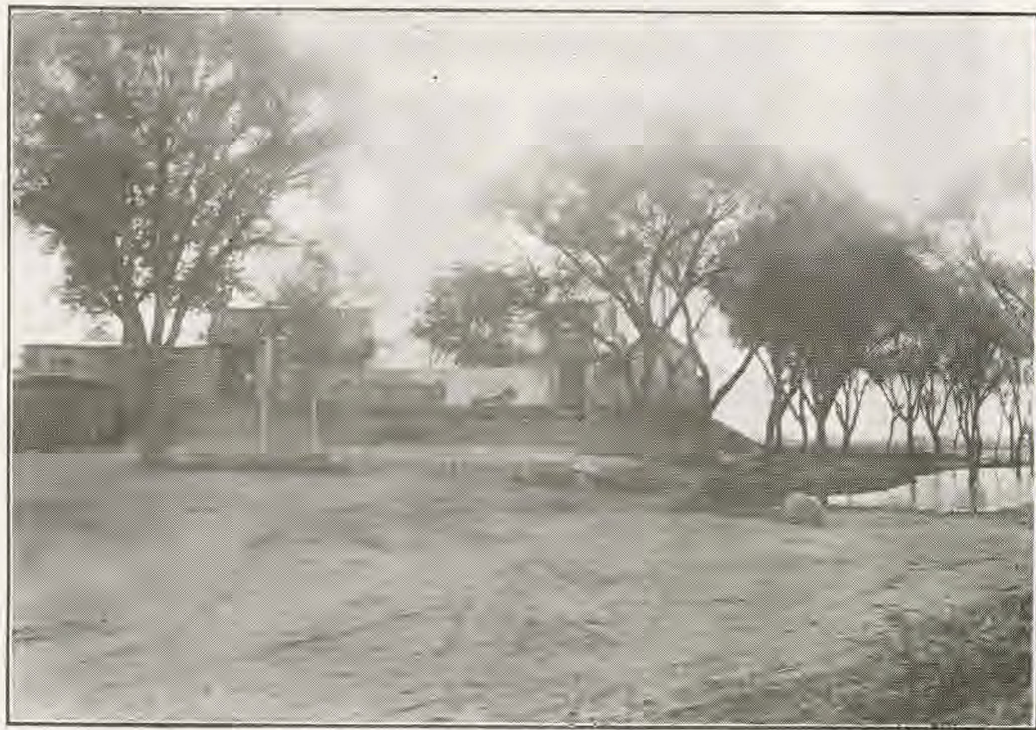
（東門外天齊廟前風景）