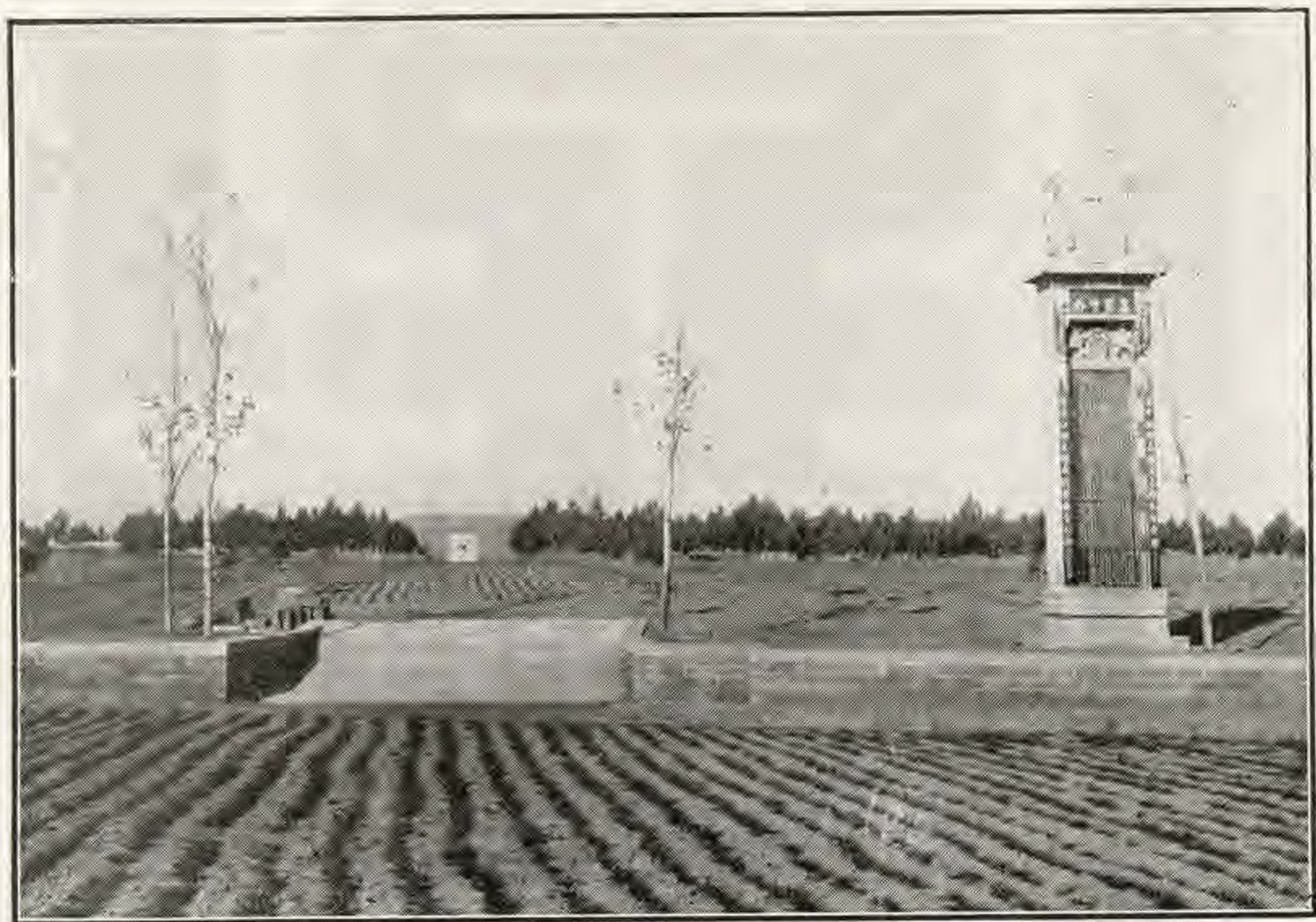
( 在 陶 鎮 西 )