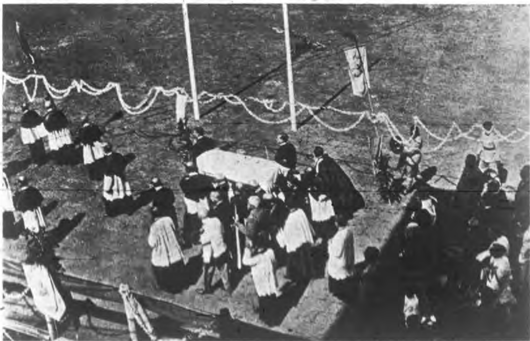
况 盛 屍 聖 各 濟 方 聖 迎 亞 臥 度 印