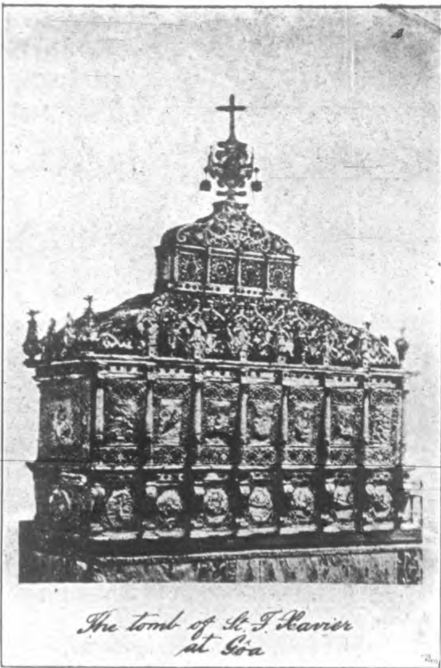
聖方濟各銀質聖柩 現存亞耶蘇聖堂