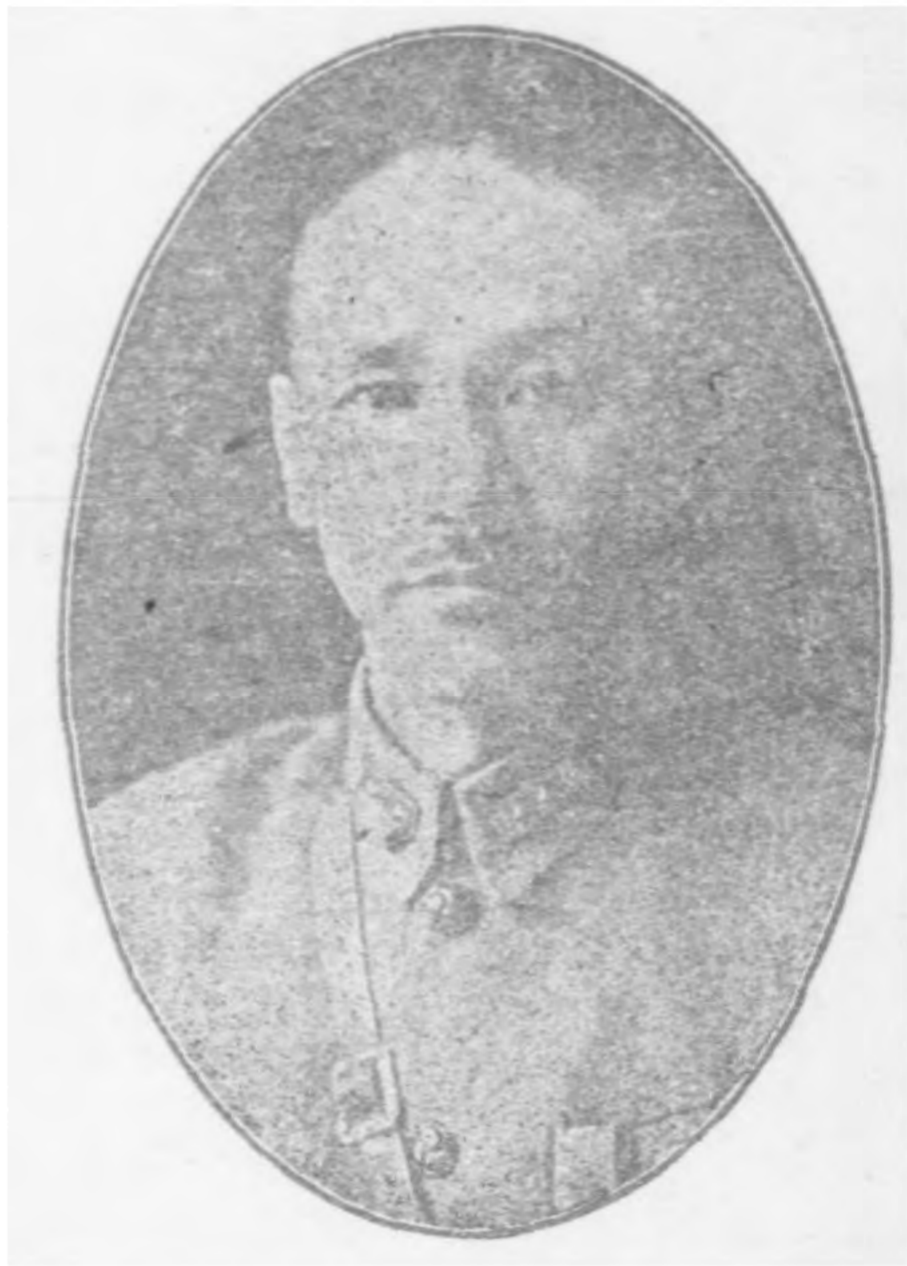
西安大東書局印行