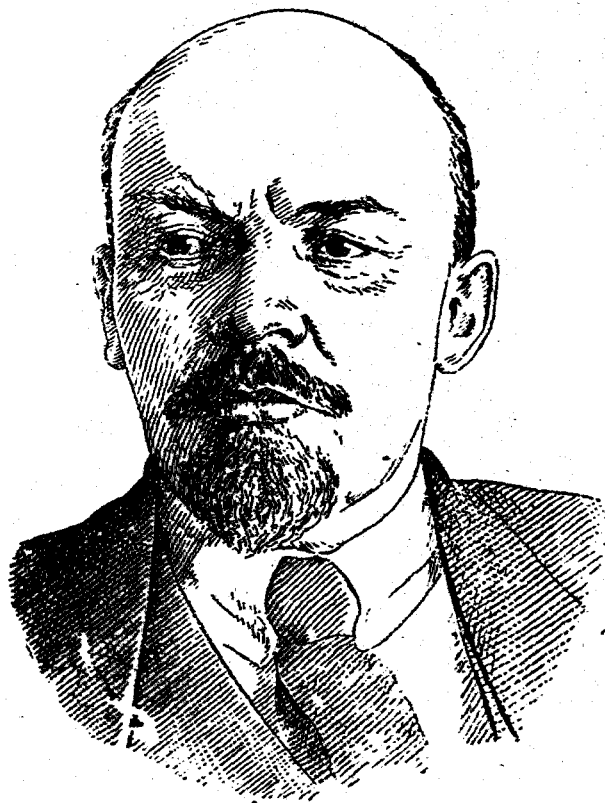
蘇聯革命領袖——列寧