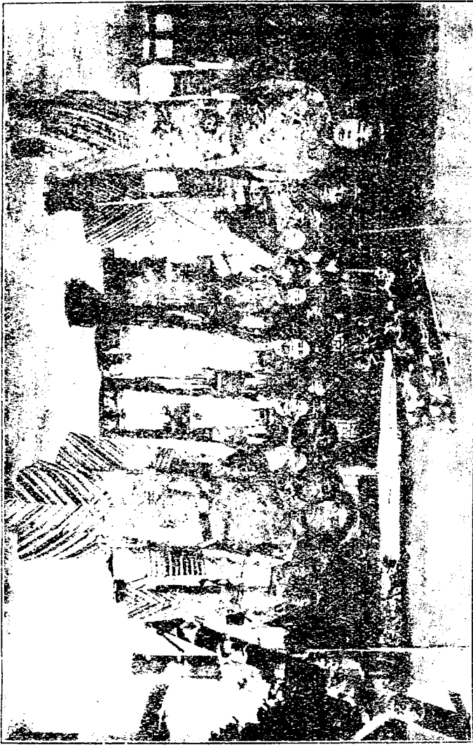
慈 禧 太 后 隆 后 恭 后 及 妃 等 今 影