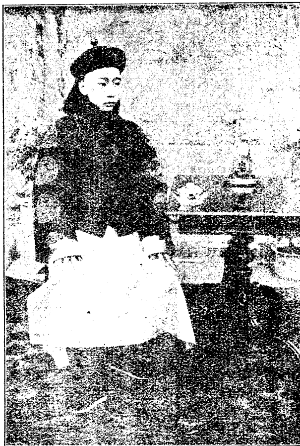
大 阿 哥 像