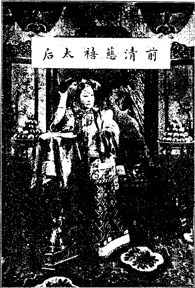
前清慈禧太后對鏡簪花圖