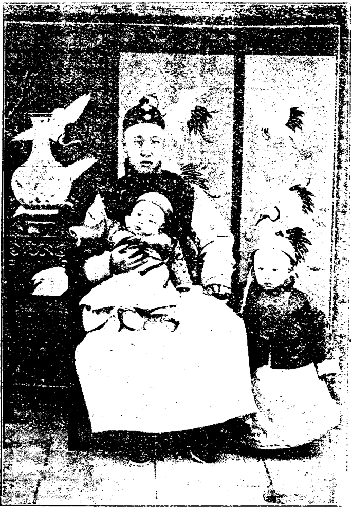
清攝政王及其二子 (譯音) 溥志 者爲 統坐 爲宣 立者