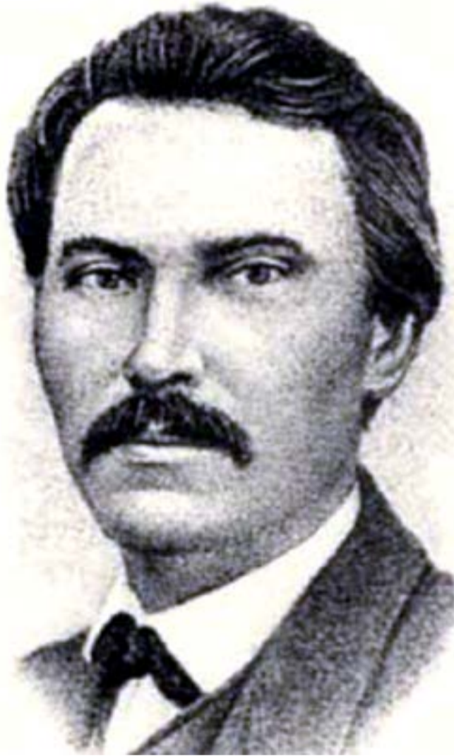
Степан Руданський 1833-1873 рр.