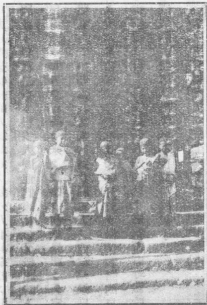
班紅馬一帶信佛之和尚