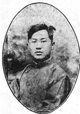
影 小 者 著