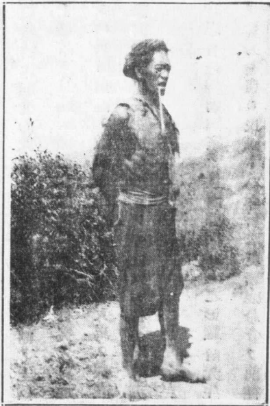
插圖(一)之在鑛山遇之見大猿

境內分佈的都是苗族的濮曼人名為卡瓦，面方頸長，皮色黃褐，性質粗簡，實有上古野蠻民族的風氣，同歷史上所述的原始人民的生活一樣。