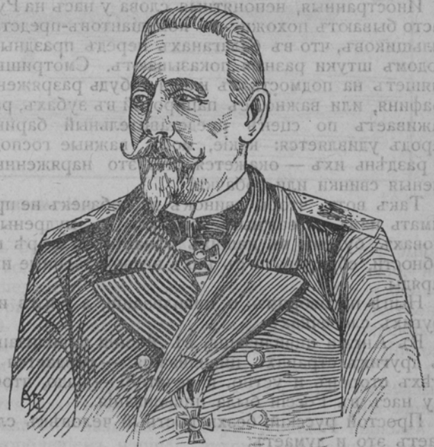
Морской Министръ вице-адмиралъ

Чему же учить насъ это житіе преп. Моисея Мурина? Конечно, оно учить насъ и тому, чтобы мы не были упорны въ своей грѣховной жизни, учить насъ и тому, что какъ бы человѣкъ ни былъ грѣшенъ, какъ бы ни была преступна и незаконна его жизнь, для него все-таки возможно придти къ сознанию этой своей грѣховности. Господь не оставляетъ безъ Своего промышленія даже и крайняго грѣшника и посылаетъ ему такіе случаи въ его жизни, которые и заставляютъ его задуматься и сознать опасность своей окончательной грѣховной гибели. Именно съ каждымъ изъ насъ, какъ бы ни были грѣшны, можетъ случиться то же, что случилось съ блуднымъ сыномъ, по евангельской притчѣ. Его Господь, такъ сказать, нашелъ и въ далекой странѣ, и въ положеніи свинопаса. Несчастіе и голодъ, посланные ему Богомъ, отрезвили его, заставили его задуматься надъ своею судьбою и придти къ раскаянію.