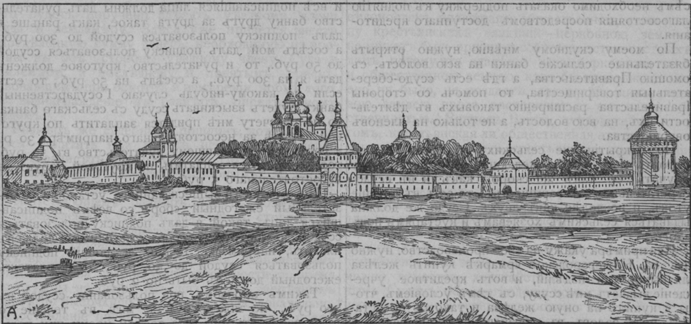
Вологодскій Спасо-Прилуцкій монастырь.

и мѣры улучшения мелкаго крестьянскаго хозяйства. 5) Крестьянское малоземелье и мѣры къ его устраненію. 6) Переселенческій вопросъ. 7) Устройство арендъ—долгосрочныхъ и краткосрочныхъ. Законодательство объ арендѣ: крестьянская аренда и опредѣленіе арендной платы. 8) Сельско хозяйственный кредитъ. 9) Союзы въ сельскомъ хозяйствѣ, сельско-хозяйственные общества, артели и потребительныя товарищества. 10) Рабочій вопросъ въ сельскомъ хозяйствѣ. 11) Учрежденіе совмѣстной закупки предметовъ сельскаго хозяйства земствами и сельско-хозяйственными обществами и 12) Упорядоченіе сельско-хозяйственной промышленности.