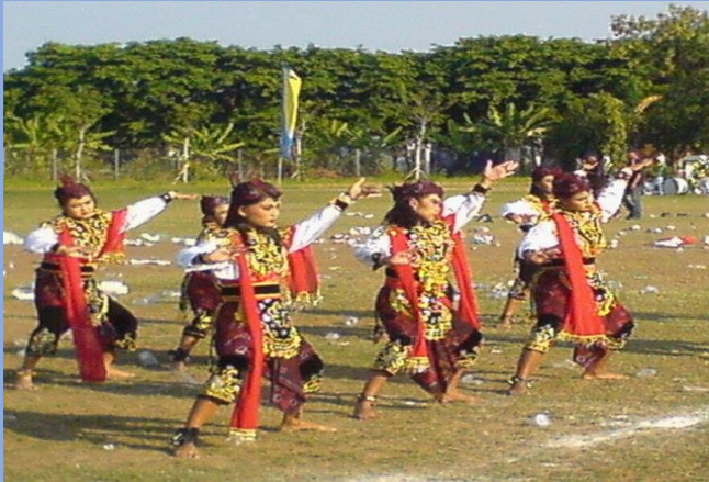
Tari Remo.jpg