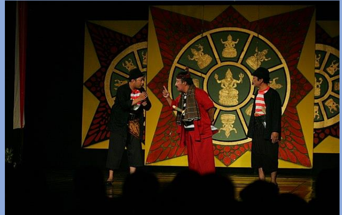
Kesenian Ludruk.jpg oleh Ivuvisual Lisensi CC BY-SA 4.0 dari Wikimedia Commons

Tari Remo adalah tarian tradisional khas Surabaya yang menggambarkan keberanian dan semangat juang para pejuang. Dengan gerakan lincah dan energik, penari mengenakan kostum warna-warni yang memukau.