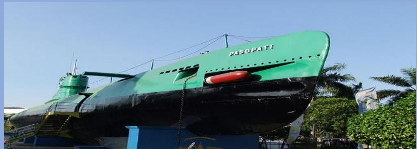
Submarine Monument Surabaya 2.JPG

Monumen Kapal Selam adalah landmark ikonik di Surabaya. Menampilkan kapal selam KRI Pasopati 410, ini menghormati jasa angkatan laut dan menarik pengunjung dengan sejarah maritim yang kaya