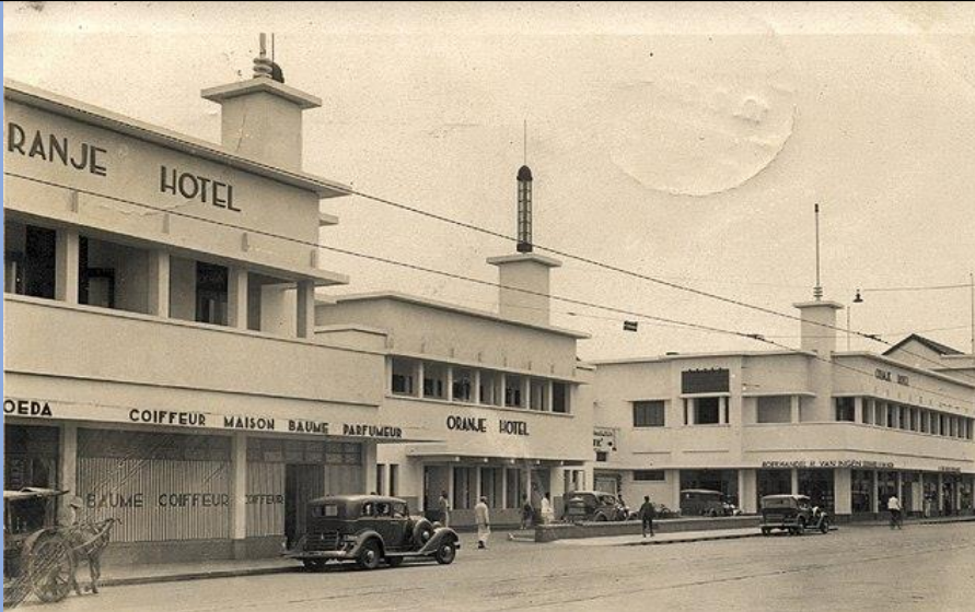
Collectie NMvWereldculturen, 7082-nf-1167, Ansichtkaart- Oranje Hotel in Surabaya, 1937.jpg , oleh NN Lisensi Public domain dari Wikimedia Commons

Hotel Oranje Surabaya adalah hotel bersejarah di pusat kota Surabaya. Didirikan pada tahun 1910 dan menjadi tempat menginap bagi para pejabat kolonial dan bangsawan. Seiring berjalannya waktu, Hotel Oranje kemudian mengalami renovasi besar-besaran dan berganti nama menjadi Hotel Majapahit