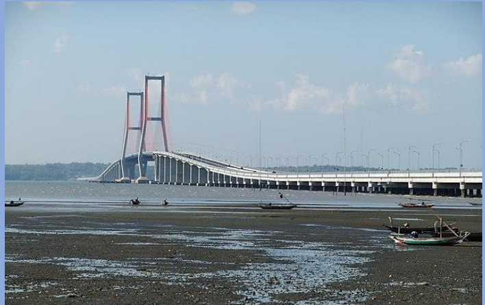
Suramadu Bridge 5.JPG oleh Sakurai Midori dilisensikan CC BY 3.0 dari Wikimedia Commons

Jembatan Suramadu adalah jembatan terpanjang di Indonesia yang menghubungkan Surabaya dan Madura. Dibangun tahun 2009, jembatan ini menjadi ikon kebanggaan dan mempermudah aksesibilitas dan kegiatan perekonomian antara Surabaya dan Madura