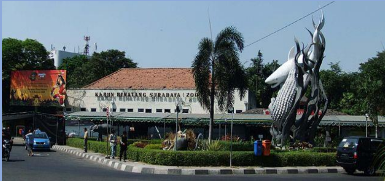
Surabaya Zoo.JPG oleh Sakurai Midori dilisensikan CC BY 3.0 dari Wikimedia Commons