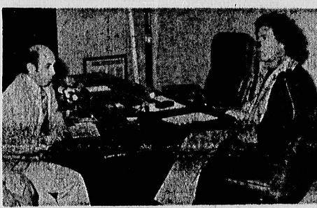
مصور تاراجی بهنگام مصاحبه با قذافی در دفتر کار او