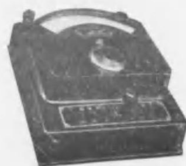
攜帶用PCP型交流電流電壓計