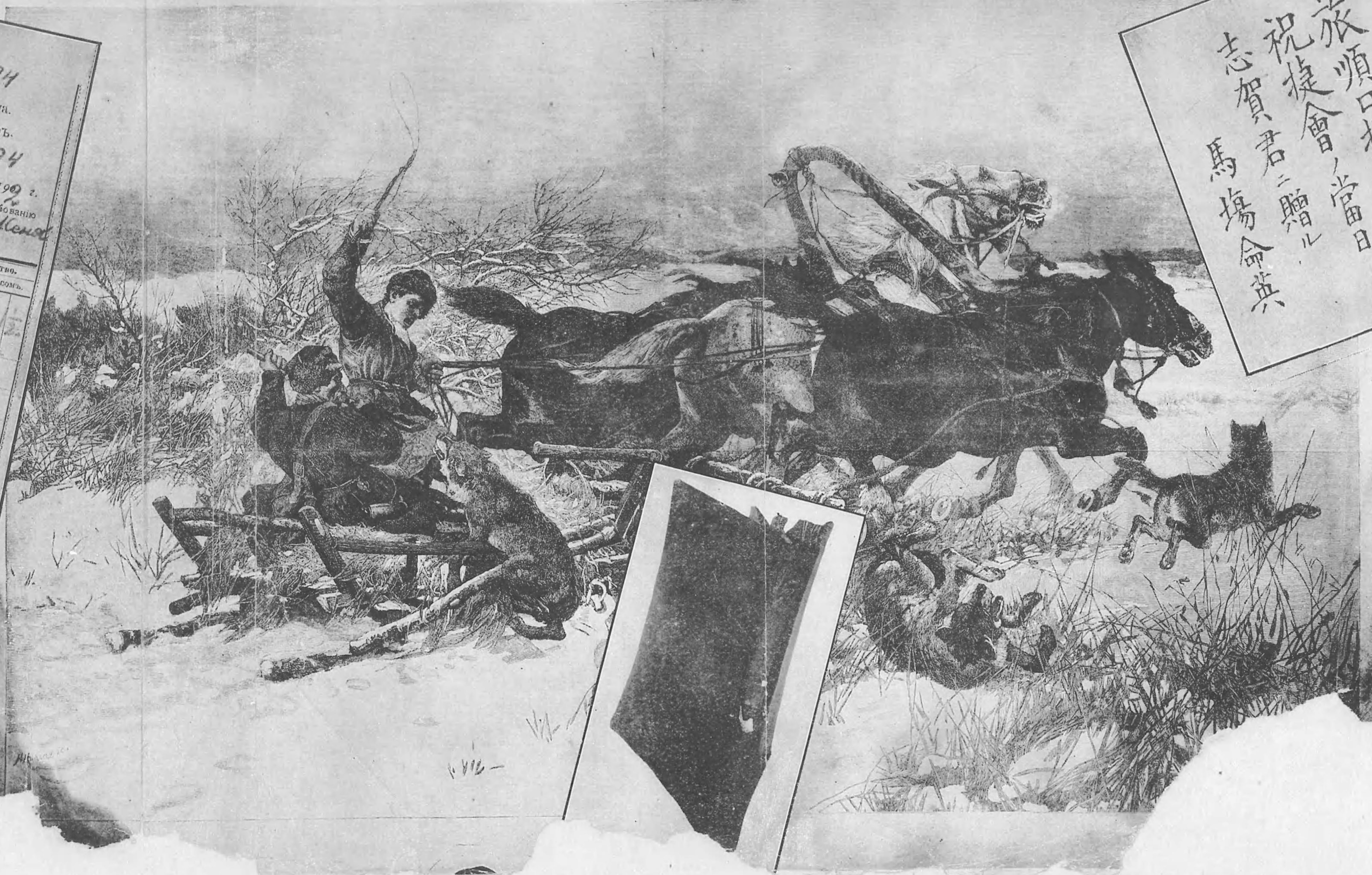
РУССКАЯ ГАЛЕРЕЯ. КАРТИНА А. КОВАЛЬКАГО.