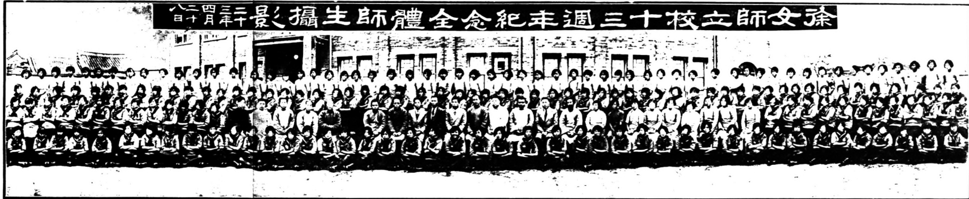
孫女師立校三十週年紀念全體師生攝影 二十三年四月十八日