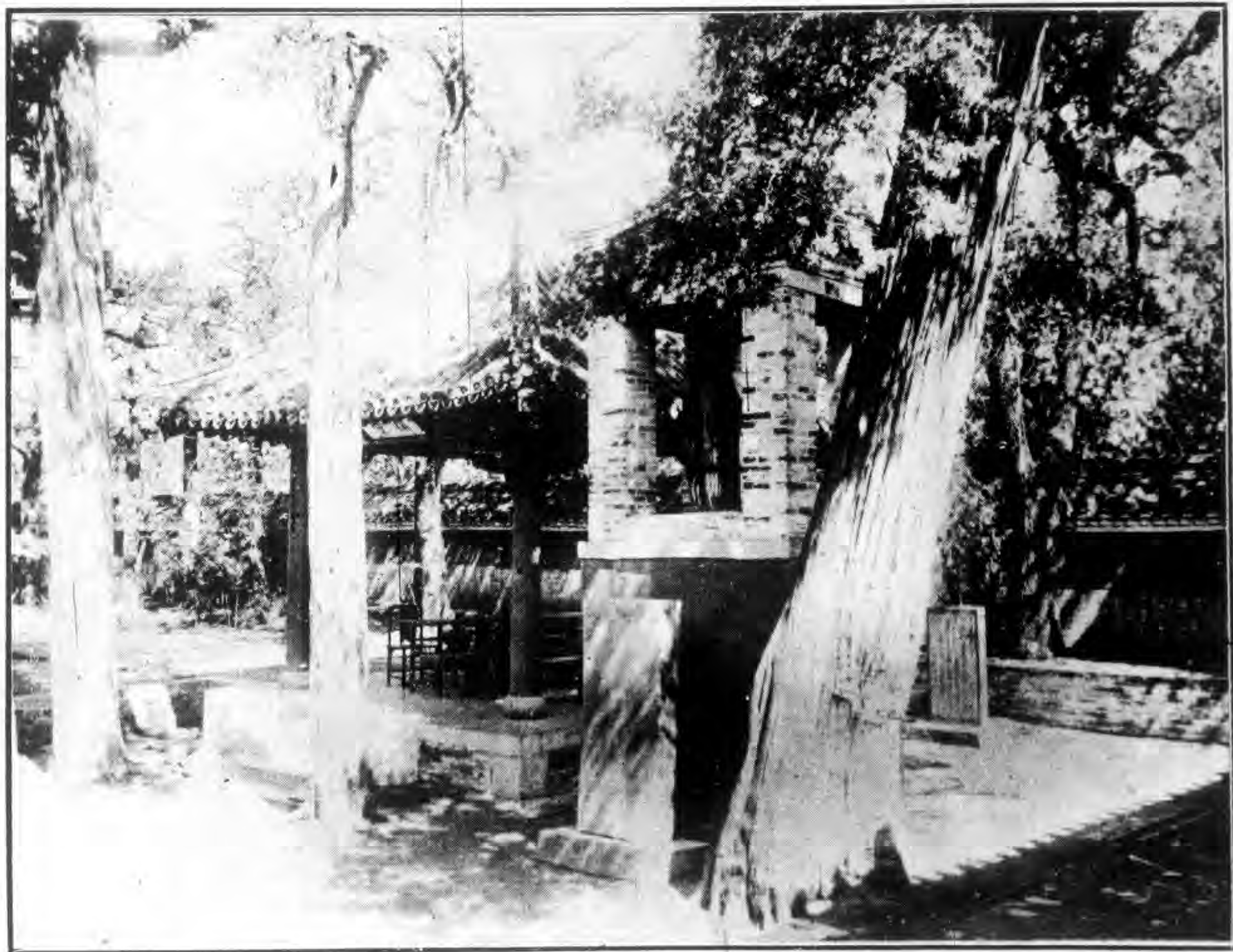
孔 林 子 貢 手 植 楷