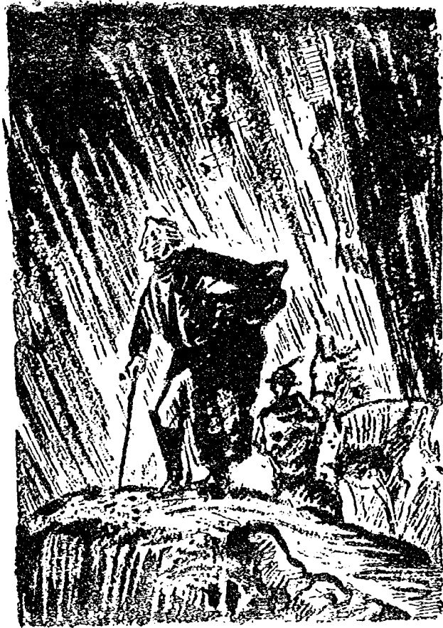
蘇 渥 洛 夫 越 過 聖 哥 塔 要 隘