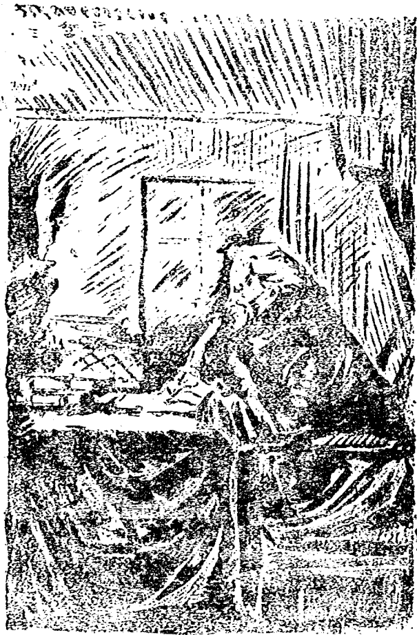
耶可斯昌孔在軍充夫洛渥蘇