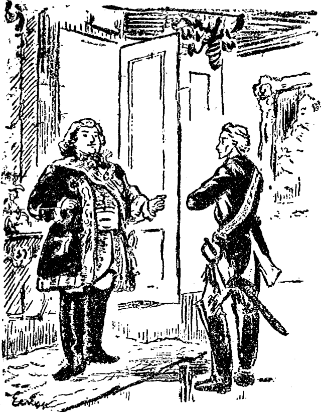
蘇渥洛和波坦金在本得