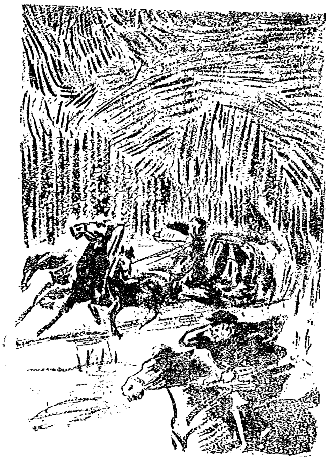
由 充 軍 返 回 聖 彼 得 堡