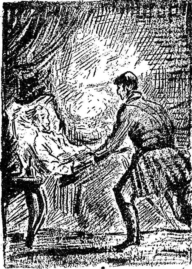
前床死臨夫洛渥蘇在昂提拉格巴