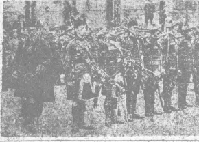
英皇檢閱蘇格蘭軍之光景