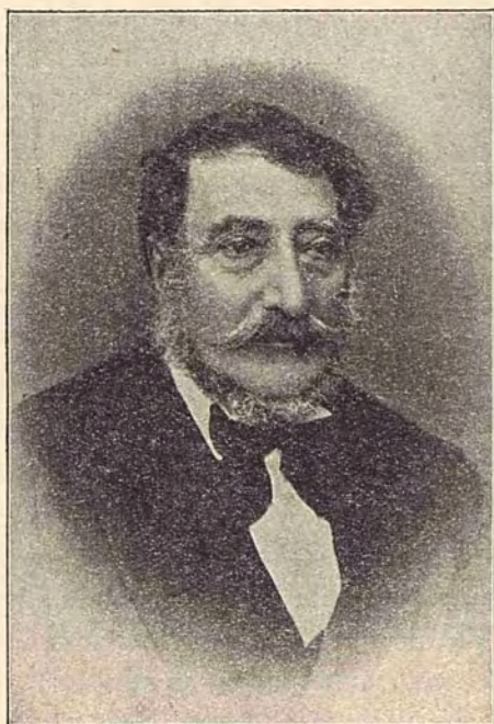
IACOB BUIUCLIU După o fotografie din 1874.

Iacob Buiucliu erà sigur că la oricare din acești doi se va adresà, va căpătà cu înlesnire aprobarea statutelor sale, vâzând fiecare în venirea