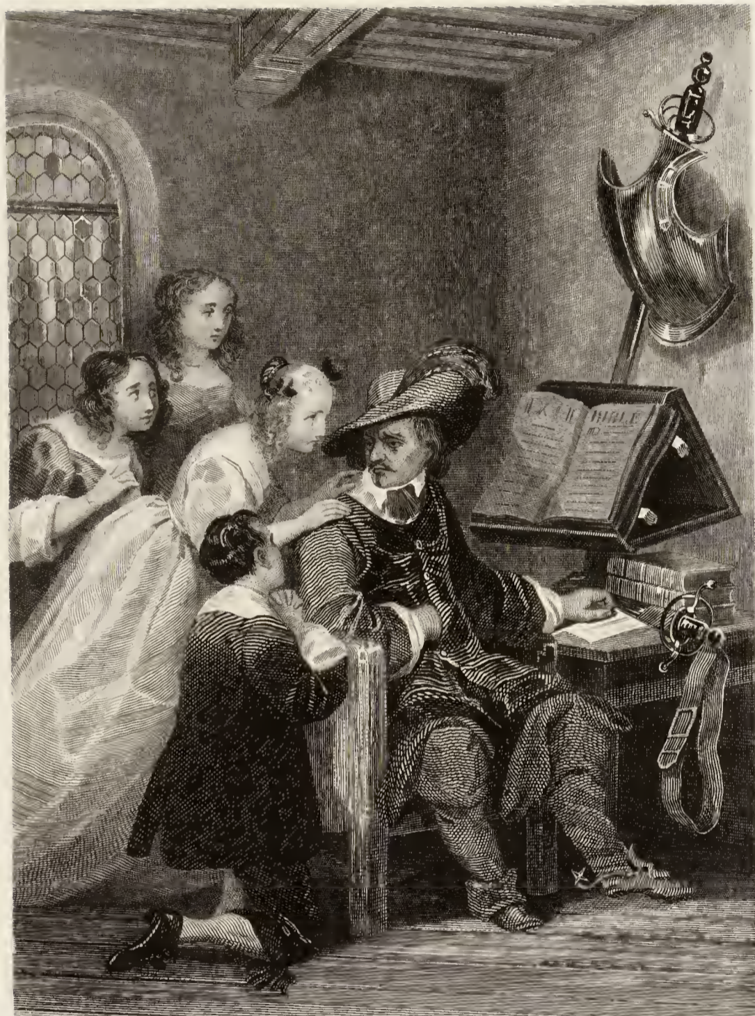
Alfred Jehannot pinx t