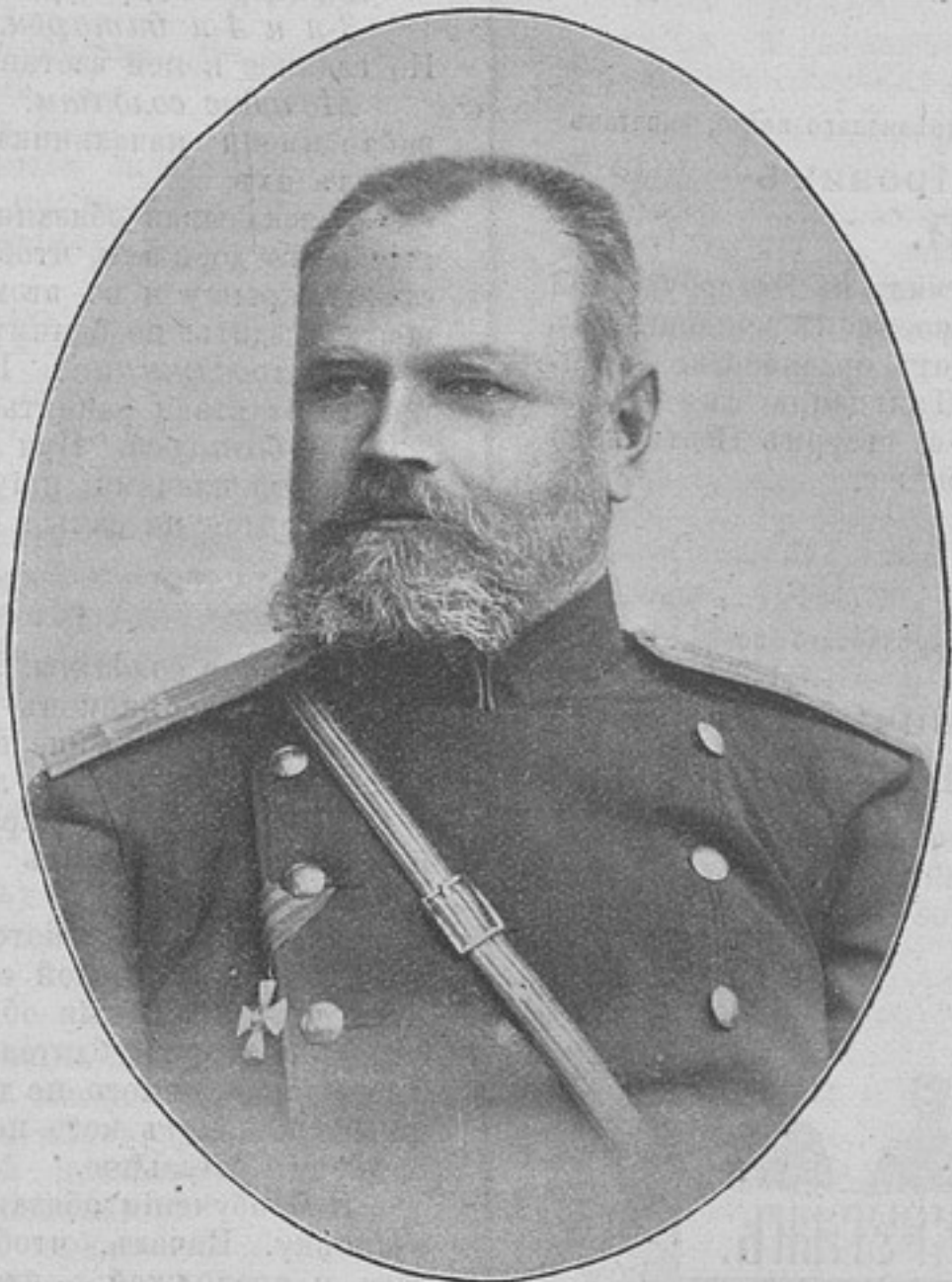
Полковникъ М. И. ШИРИНСКІЙ.

Годъ XV. Начать съ № 585. —♦— С.-Петербургъ, Колокольная, 14. ♦— Выходить еженедѣльно.