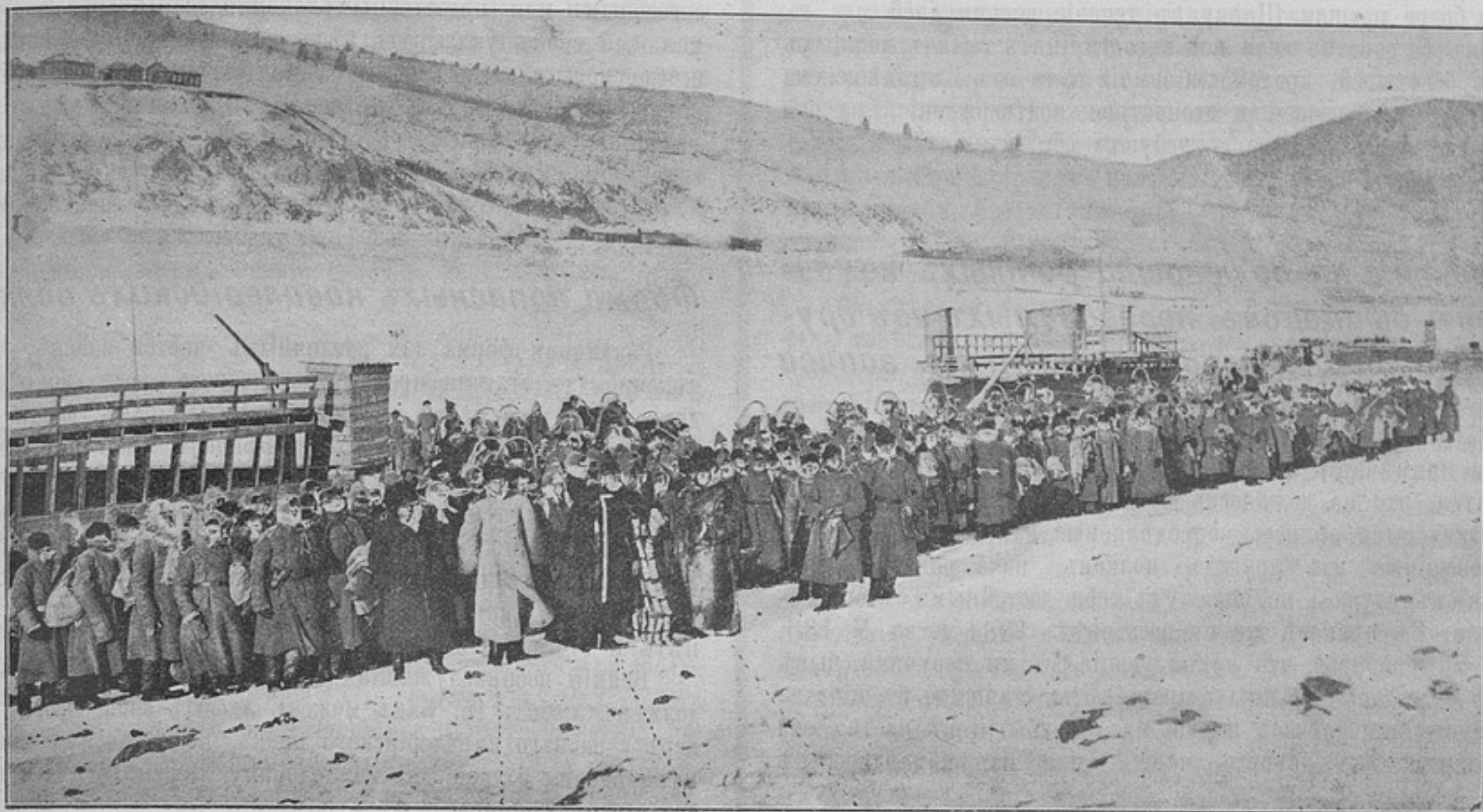
Партия запасныхъ въ Стрѣтенскѣ въ декабрѣ 1900 г. (къ статьѣ «Обратный походъ запасныхъ съ Амура»).

Весь Амуръ, сплошь оказался покрытымъ судами идущими внизъ. Все это пришлось повернуть назадъ. Ближайшимъ къ Стрѣтенску эшелонамъ удалось своевременно дойти до желѣзной дороги; части пришлось высадиться на Шилкѣ въ разныхъ пунктахъ и, пользуясь къ тому времени открытыми этапами, совершить походный маршъ; а застигнутые ледохо-