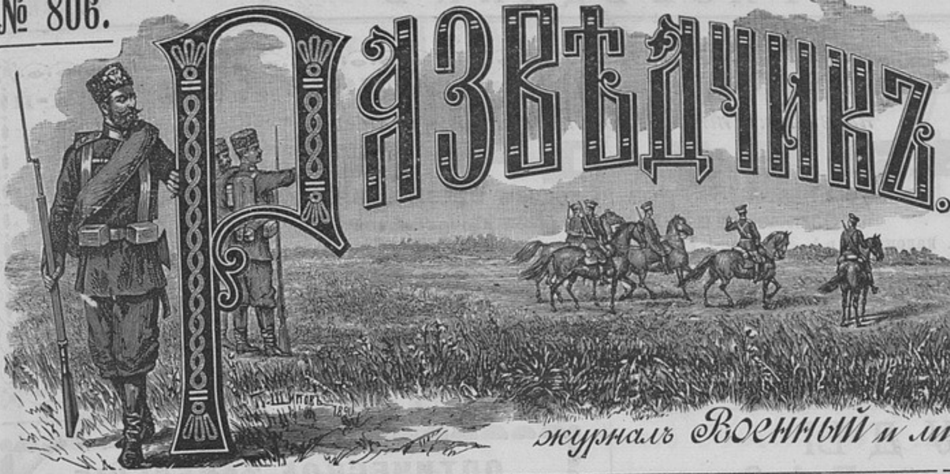
журналъ Военный и литературный.

Подписная цѣна съ доставкой и пересылкой на годъ . . . . . 6 руб. На 1/2 года 4 р., на 3 мѣсяца 2 р., за границу 8 р. Отдѣльные №№ по 15 н. За перемѣн. адр. 28 к. Статьи и замѣтки должны быть за под- писью и адрес. автора. Въ случаѣ надобн. статьи передѣлыв. въ ре- дакц. Для личныхъ объясн. ре- дакц. открыта исключ. праздн., по понедѣльн., среда и пятни- цамъ отъ 3 до 5 час. вечера.