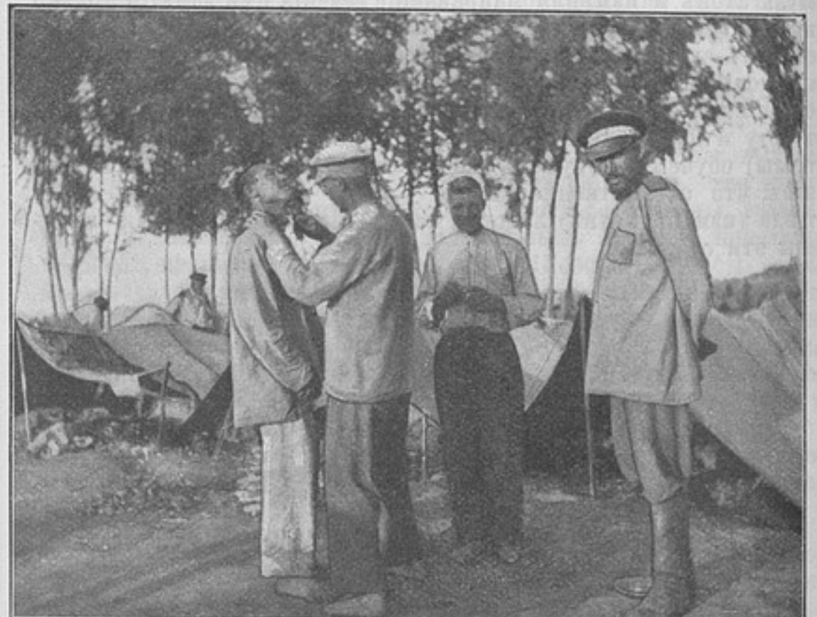
Бивакъ при д. Чаньдяфыньфань. «Походный парикмахеръ».

Что касается упряжныхъ лошадей, подлежащихъ аукціонной продажѣ, то нельзя не вспомнить приказъ по воен. вѣд. 1899 г. № 141, установившій для старшихъ начальниковъ, начиная отъ командировъ неотдѣльныхъ бригадъ, особый отпускъ фуражныхъ денегъ на упряжныхъ лошадей. Число ихъ опредѣлено было для командировъ корпусовъ—4, для начальниковъ дивизій—4, для командировъ бригадъ—2.