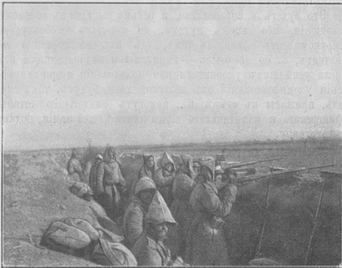
Передовой окопъ д. Даліантунь (Ноябрь 1904 г.).

Такія лошади имѣются не только въ Сибири и Манчжу-