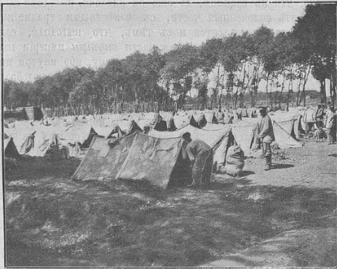
Бивакъ 1-го баталіона при д. Чаньдяфыньфань (Іюль 1905 г.).

Изъ боевой и походной жизни 243 го пѣх. Златоустовскаго полка въ Манчжуріи. (Фотогр. поруч. Слатина).