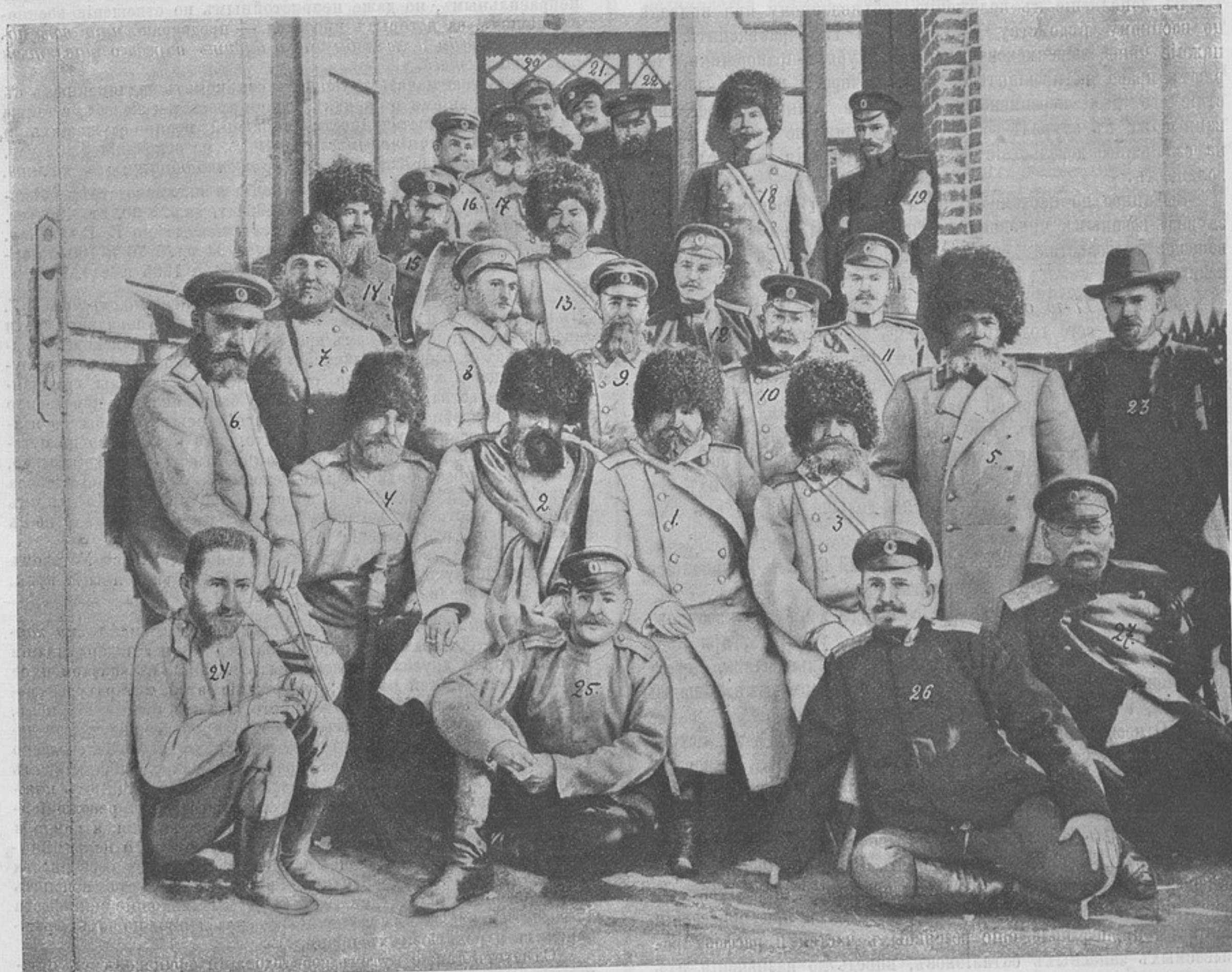
Ген.-лейт. Р. И. Кондратенко со штабомъ западнаго фронта сухопутной обороны Портъ-Артура (въ ноябрѣ 1904 г.)