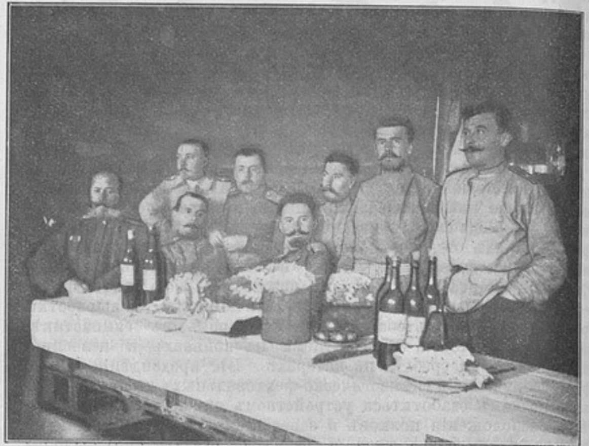
Пасхальный столъ въ Манчжуріи (1905 г.). Командиръ и офицеры полка.

Иныхъ средствъ устранить этотъ недостатокъ нашего генеральнаго штаба—нѣтъ. Пока не будетъ казенныхъ верховыхъ лошадей, нашъ генеральный штабъ будетъ пѣшимъ, хотя бы отпустили четверныя фуражныя деньги.