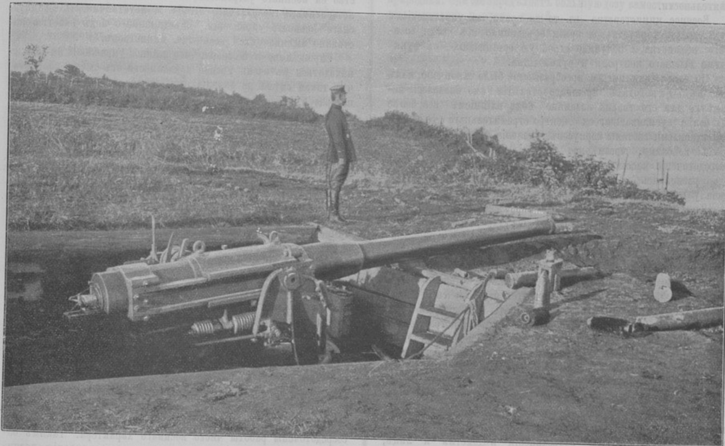
Часть русской позиціи около Корсаковска, на Сахалинѣ.

Военное министерство, образованное въ 1802 году, въ 1812 г. изъ Коллегіи петровскаго типа, превращается въ чисто-бюрократическое учрежденіе съ цѣлой серіей департаментовъ, имѣя во главѣ военнаго министра, окруженнаго многочисленной арміей чиновниковъ въ офицерскихъ и иныхъ мундирахъ. Черезъ три года (въ 1815 г.) оно превращается въ два отдѣльных другъ отъ друга высшихъ вѣдомства — Главнѣйшій Штабъ Его Императорскаго Величества со всемогущимъ начальникомъ штаба и собственно военное министерство,