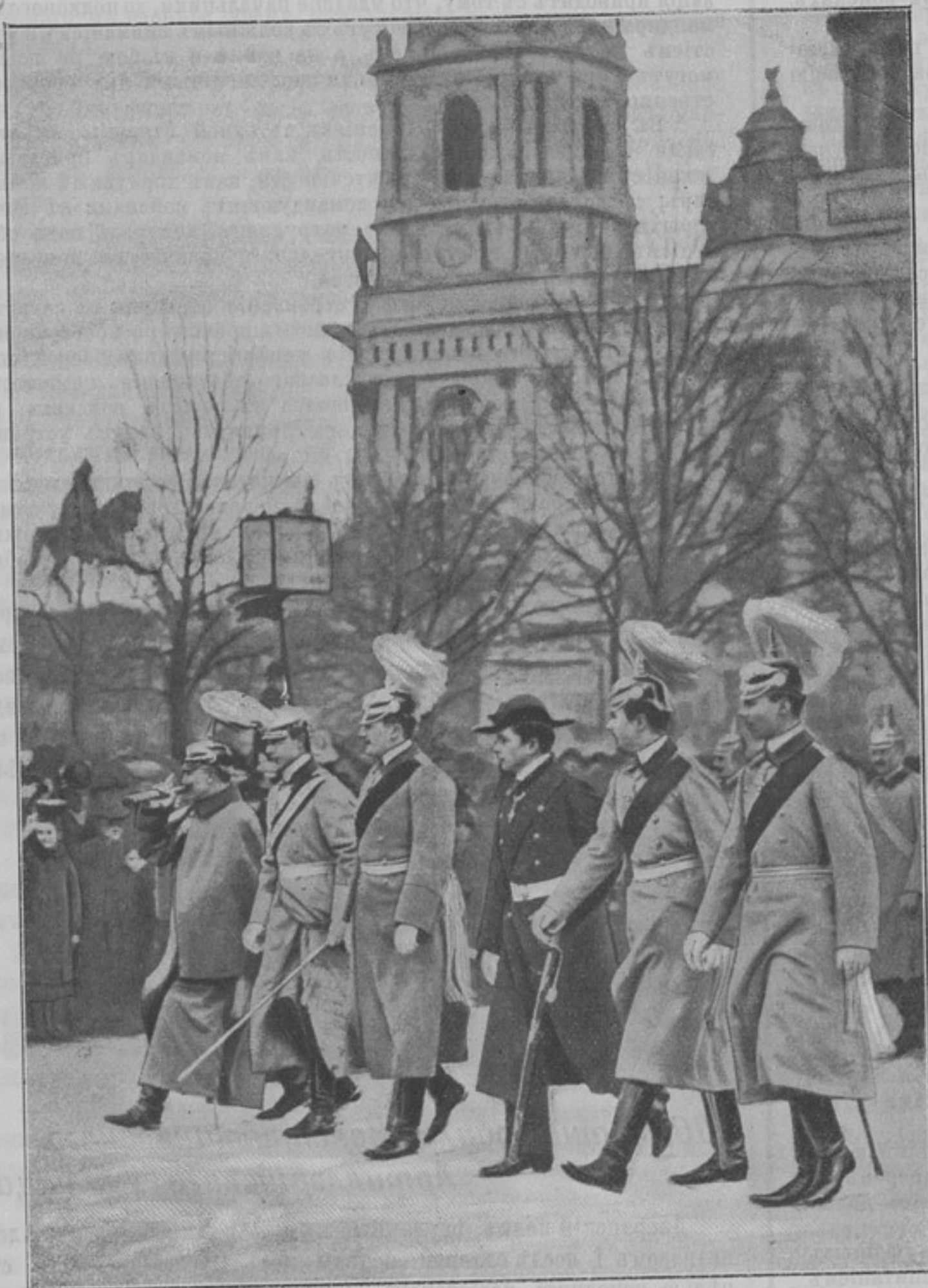
Императоръ Германскій Вильгельмъ II и его сыновья. 1) Вильгельмъ II. 2) кронпринцъ Фридрихъ. 3) принцъ Эйтель. 4) принцъ Адальбертъ. 5) принцъ Августъ. 6) принцъ Оскаръ.

ставляетъ уже цѣнное хранилище предметовъ, относящихся до жизни знаменитыхъ питомцевъ: Драгомирова, Щеголева, Черныяева и др. Весьма желательно, чтобы бывшіе воспитанники или ихъ родственники оказали содѣйствіе въ пополненіи музея документами, описаніями, рисунками, фотографіями и пр., относящихся до жизни дворянъ и константиновцевъ; этимъ они окажутъ услугу дѣлу, имѣющему въ стѣнахъ учебнаго заведенія высокое воспитательное значеніе. Предметы можно адресовать на имя хранителя музея капитана фонъ-Озаровскаго, который въ настоящее время занятъ также составленіемъ обширной исторіи Дворянскаго полка и преемственныхъ ему учебныхъ заведеній; къ дню юбилея предположено выпустить въ свѣтъ первый томъ, обнимающій собою періодъ въ 50 лѣтъ, а также списокъ всѣхъ питомцевъ, произведенныхъ въ офицеры за столѣтній періодъ. Въ память юбилея будетъ выбита соотвѣтствующая