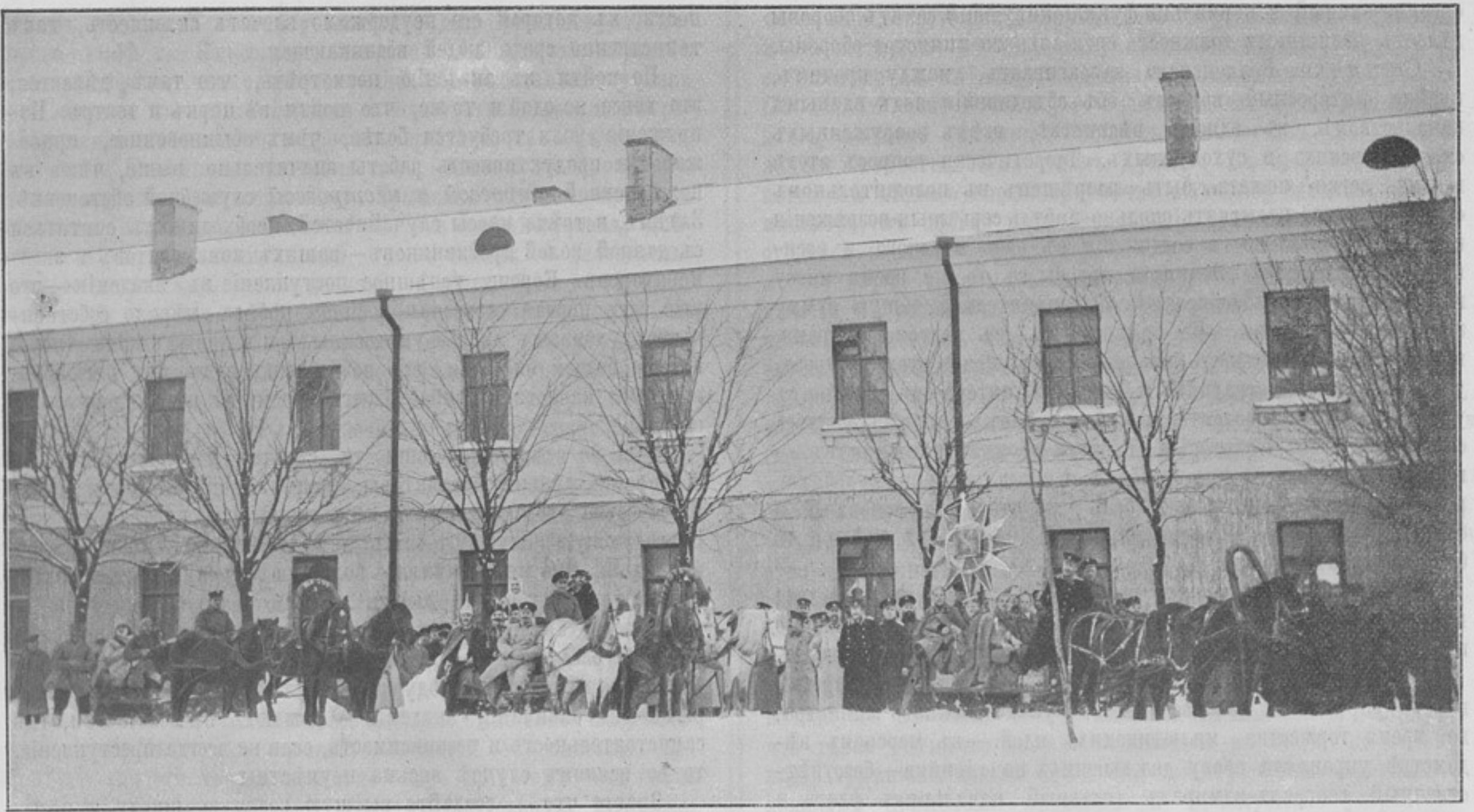
Святочныя тройки полковой учебной команды 116-го пѣх. Малоярославскаго полка. (Къ кор. «Рига»).

большой неблагодарностью своей «Альма-матеръ» — взобравшись съ помощью ея диплома на крышу арміи, государства, они въ большинствѣ случаевъ оттолкнули ея серьезные интересы, какъ лѣса, ненужные при поконченномъ зданіи блестящей карьеры... Они наслаждаются своимъ достигнутымъ положеніемъ — и... только, порвавъ съ академіей и обычную и духовную связь. Куда дѣлся методъ и принципы строгой академической работы, твердость спеціальнаго мнѣнія: большинство или измѣнили и «продали», въ угоду служебной покладистости, тихаго служебнаго плаванія — «ученую шпагу свою».