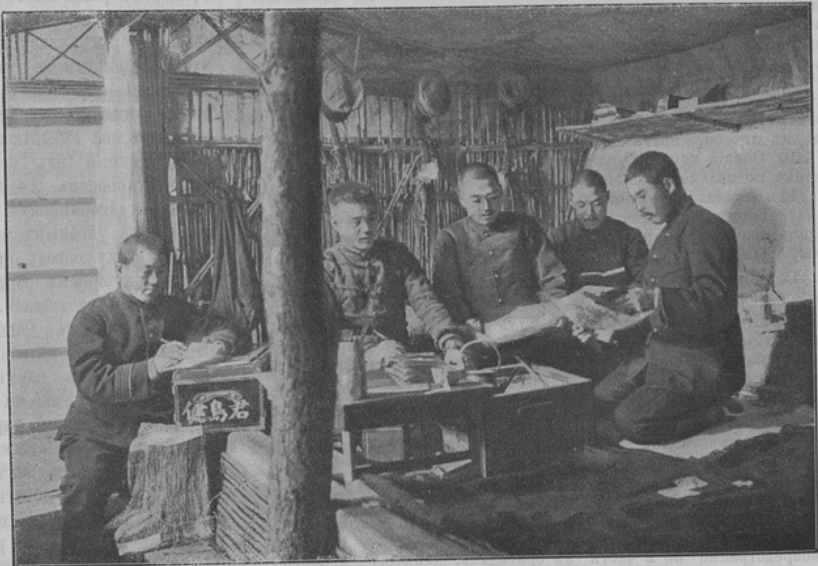
Внутренность японской землянки около Шимьяоцзы.

За эти два года мы видѣли нервную, судорожающую, лихорадочную работу военнаго вѣдомства, рядъ отдѣльныхъ, другъ съ другомъ несвязанныхъ и мало согласованныхъ мѣропріятій, крупныхъ и мелкихъ: учрежденіе совѣта государственной обороны и должности начальника генеральнаго штаба, сокращеніе сроковъ дѣйствительной службы при оставленіи въ полной силѣ старыхъ несовершенныхъ приемовъ обученія войскъ, установленіе прорѣзи для шашки въ пальто, новая форма