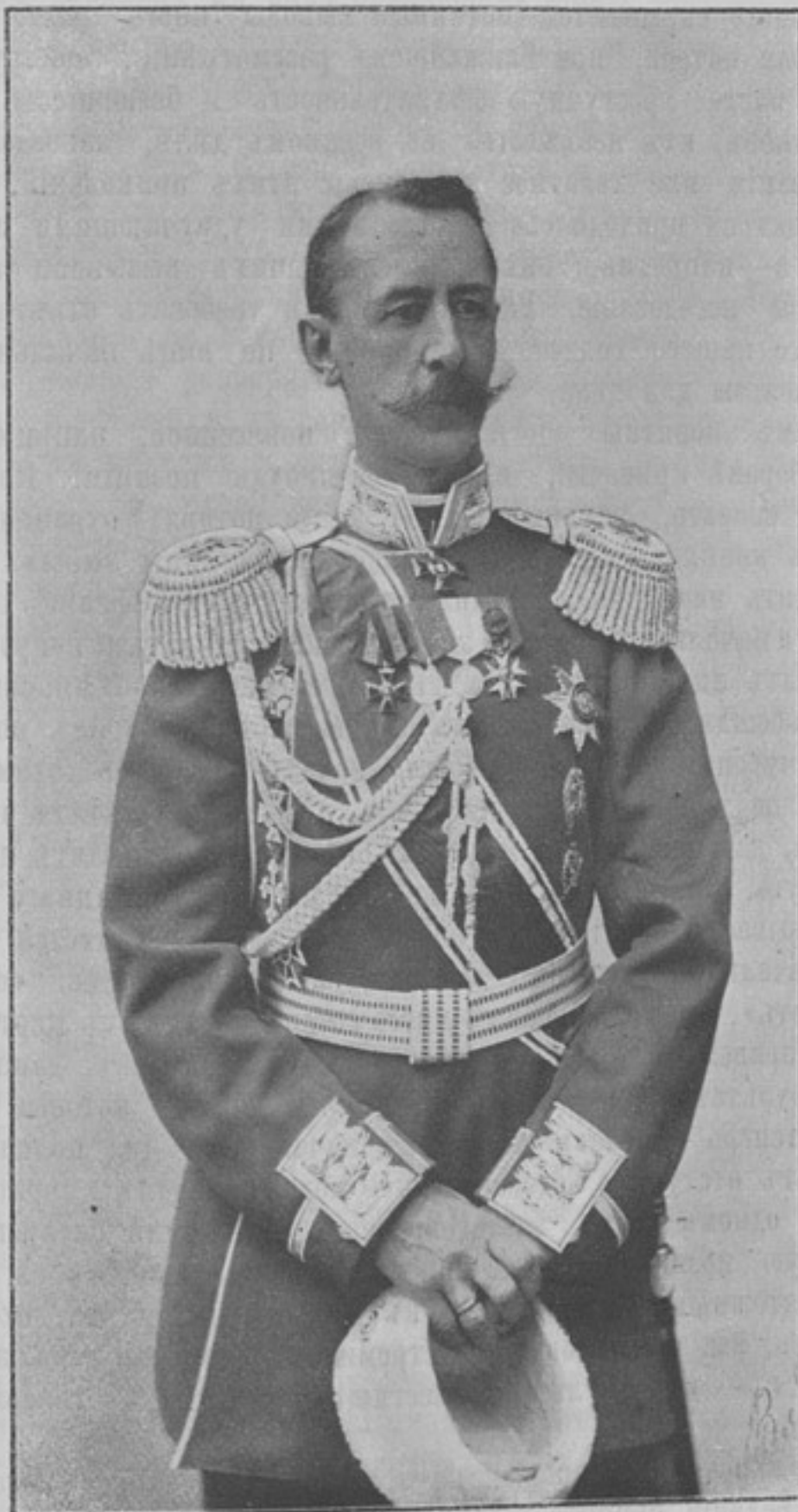
Начальникъ Николаевской академіи генеральнаго штаба, Свѣты Его Величества генераль-маіоръ