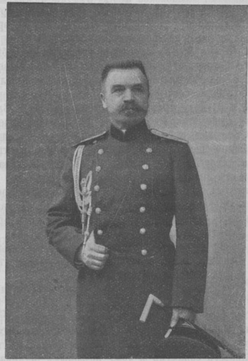
Генераль-отъ-кавалеріи Владиміръ Викторовичъ САХАРОВЪ,

награжденный орденомъ св. Георгія 4-й степени, происходитъ изъ дворянъ Витебской губ.; родился въ 1851 г., по окончаніи Полоцкаго кадетскаго корпуса поступилъ во 2-е военное Константиновское училище, откуда перешелъ въ Николаевское инженерное училище, изъ котораго и былъ выпущенъ офицеромъ 22-го іюня 1872 г. въ 19-ю артиллерійскую бригаду. Въ чинѣ штабсъ-капитана Е. А. участвовалъ въ войнѣ 1877 г. Въ 1902 г. Е. А. произведенъ въ генераль-майоры съ назначеніемъ командиромъ 10-й арт. бригады, съ которой и отправился въ 1904 г. на войну съ Японіей, а въ 1905 г. назначенъ командующимъ 72-ю пѣхотною дивизіею. Генераль Радкевичъ принималъ видное участіе во многихъ сраженіяхъ. Въ 1908 г. Е. А. былъ назначенъ командиромъ 3-го Сибирскаго армейскаго корпуса. Въ 1912 г. произведенъ въ генералы-отъ-инфантеріи съ увольненіемъ отъ службы. Съ началомъ настоящей войны онъ вновь опредѣлился на службу.