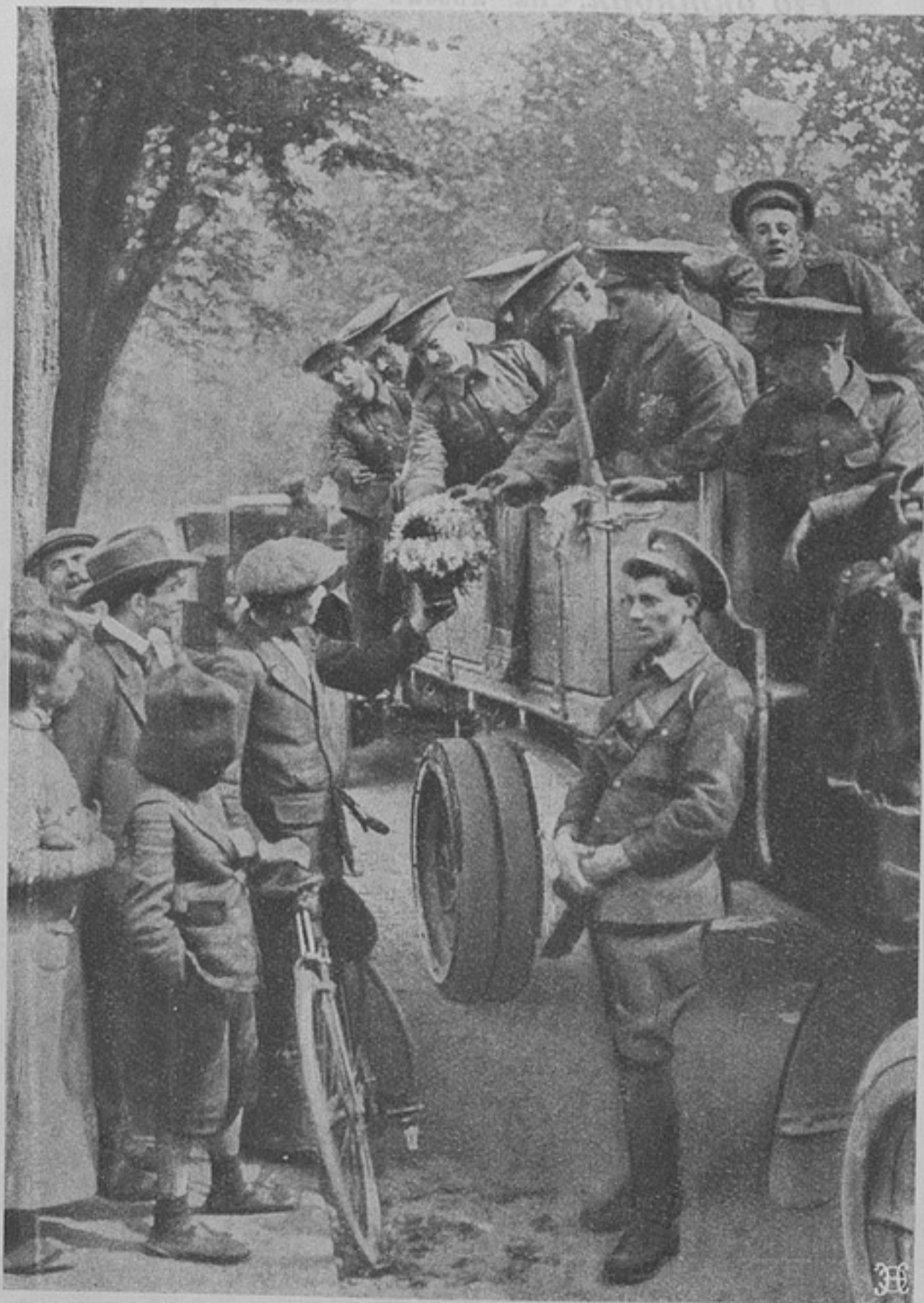
Встрѣча англичанъ во Франціи.

Въ ночь съ 29-го на 30-е сентября происходили бои на лѣвомъ берегу Савы, на фронтѣ Ада-Цыганлія, притока Саввы около Дуная. Всѣ атаки австрійцевъ были отражены. Они понесли огромныя потери и отступили въ большомъ беспорядкѣ къ Бежаньи, оставивъ на полѣ битвы 300 человекъ убитыми и ранеными. Много неприятельскихъ солдатъ сдается сербскимъ передовымъ отрядамъ, подвигающимся къ Бежаньи и землинскому вокзалу.