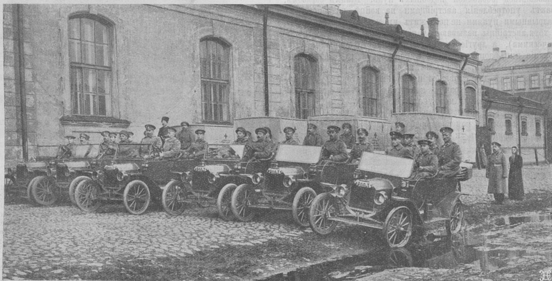
Автомобильный поѣздъ для перевозки раненыхъ имени русскаго Общества пароходства и торговли.

29-го сентября. На лѣвомъ флангѣ французы снова перешли въ наступленіе въ районахъ Азбрукъ и Бетюнъ противъ непріятельскихъ силъ, состоящихъ преимущественно изъ кавалерійскихъ частей, взятыхъ съ фронта Байель — Эстеръ — Лабассэ. Городъ Лилль, занятый отрядомъ французскихъ территоріальныхъ (второочередныхъ) войскъ, былъ атакованъ и занятъ корпусомъ германской арміи. Между Аррасомъ и Альберомъ союзники замѣтно прошли впередъ. Въ центрѣ они продвинулись въ районѣ Берри-о-Бакъ, а также слегка по направленію къ Суэну на западъ отъ Аргоннъ и къ сѣверу отъ Маланкура между Аргонной и