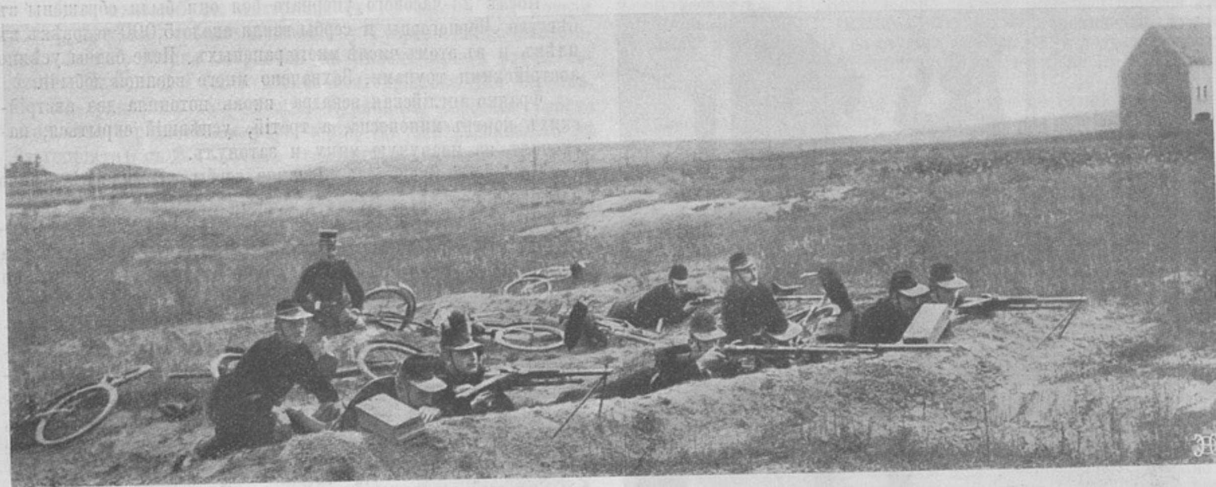
Бельгійскіе велосипедисты въ бою.

Маасомъ. На правомъ берегу Мааса французскія войска, въ рукахъ которыхъ находится Мааская возвышенность на востокъ отъ Вердена, продвинулись на югъ отъ дороги Верденъ — Мецъ. На правомъ флангѣ французы также продвинулись впередъ. Въ районѣ Апремонъ, они отразили атаки германцевъ, направленные на ихъ лѣвый флангъ. На правомъ флангѣ въ Вогезахъ и Эльзасѣ положеніе безъ перемѣнъ. Въ общемъ день отмѣченъ замѣтными успѣхами. На лѣвомъ флангѣ вплоть до Уазы военныя операціи развиваются нормально для союзниковъ. Въ центрѣ успѣхи въ районѣ Берри-о-Бакъ они значительно продвинулись впередъ. На правомъ флангѣ не произошло ничего новаго.