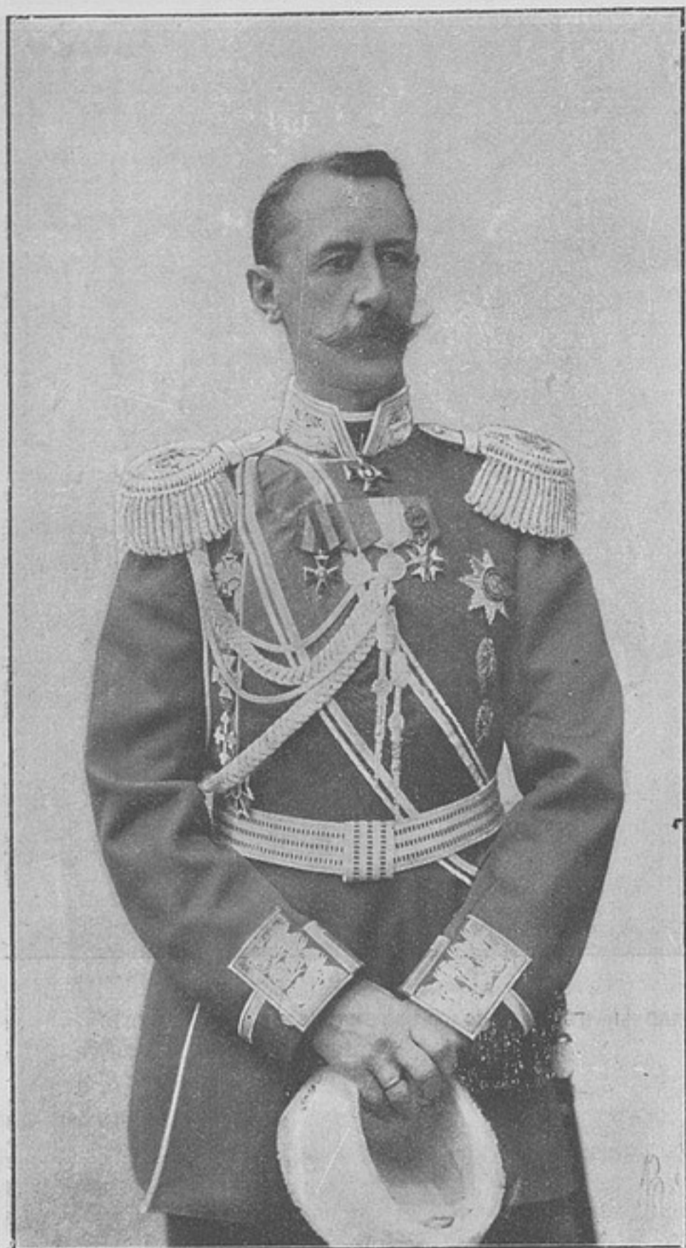
Генераль-лейтенантъ Дмитрій Григорьевичъ ЩЕРБАЧЕВЪ,

награжденный орденомъ св. Георгія 4-й степени, происходитъ изъ потомственныхъ дворянъ Петроградской губерніи, родился въ 1857 году, образованіе получилъ въ Орловской-Бахтина военной гимназій, въ Александровскомъ военномъ училищѣ, въ Михайловскомъ артиллерійскомъ училищѣ и въ Николаевской