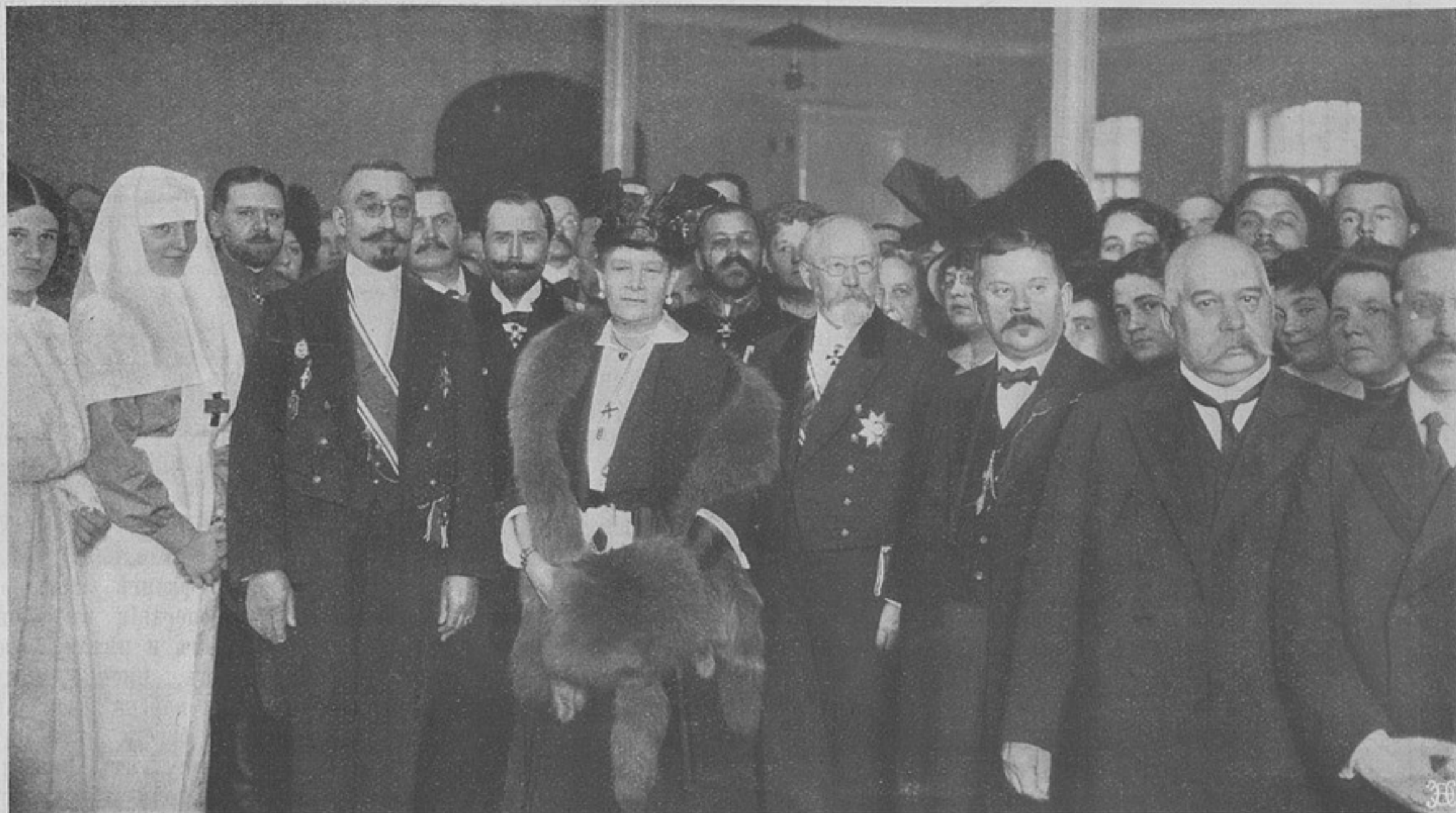
Освященіе лазарета имени Е. И. В. Великой Княгини Маріи Павловны, въ Охтенскомъ техническомъ училищѣ.

доставлены въ сентябрѣ въ кievскій артиллерійскій складъ, въ которомъ подвергнуты тщательному осмотру. Ящики деревянные, продолговатой формы, съ желѣзными наугольниками. Въ каждомъ изъ нихъ оказалось 135 картонныхъ пачекъ, въ пачкахъ по двѣ обоймы съ 5-ю патронами.