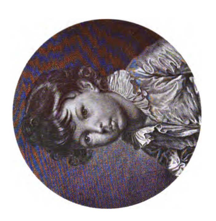
K.II BOFORDJE HCK