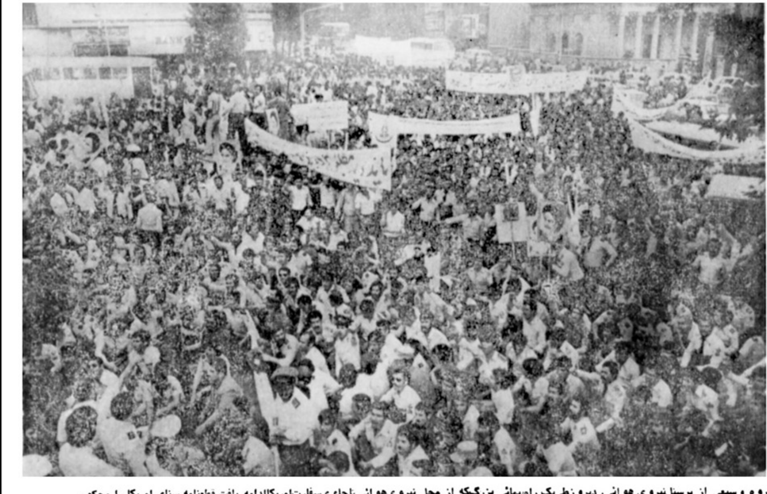
گروه وسیعی از برسل نیروی هوایی، دیروز طی یک راهپیمایی بزرگکه از محل نیروی هوایی ناغوی سفارت امریکادامه یافت فتنانه سنای امریکا را محکوم کردند. عکس یک صحنه از راهپیمایی نیروی هوایی راجلوی سفارت امریکا نشان میدهد.