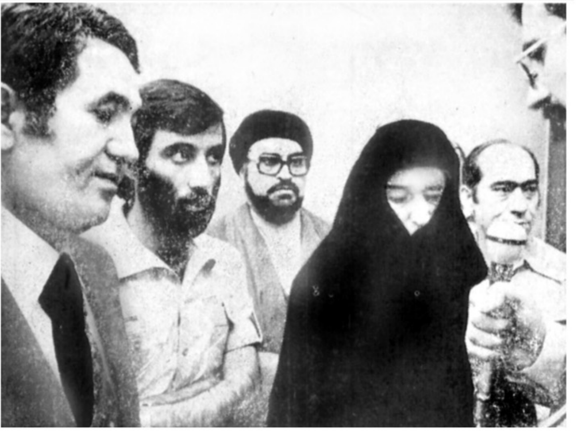
همسر حجت الاسلام رفسنجانی پس از اطمینان از اینکه خطر گذشته است بیمارستان شهدا را ترک میکند در کنار او تنی چند از نزدیکان و آشنایان دیده میشوند.

بیام امام خمینی به حجت الاسلام هاشمی رفسنجانی