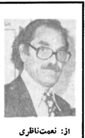
از: نعمت نظاری

* خمیر مایه لایحه جدید، همان لوایح چهارگانه پیشین عصر استبداد و دیکتاتوری است * جز چند تغییر اصلاحی نهنقلابی- اصلاحات دیگر در لایحه جدید مطبوعات غالباً لفظی و سطحی است