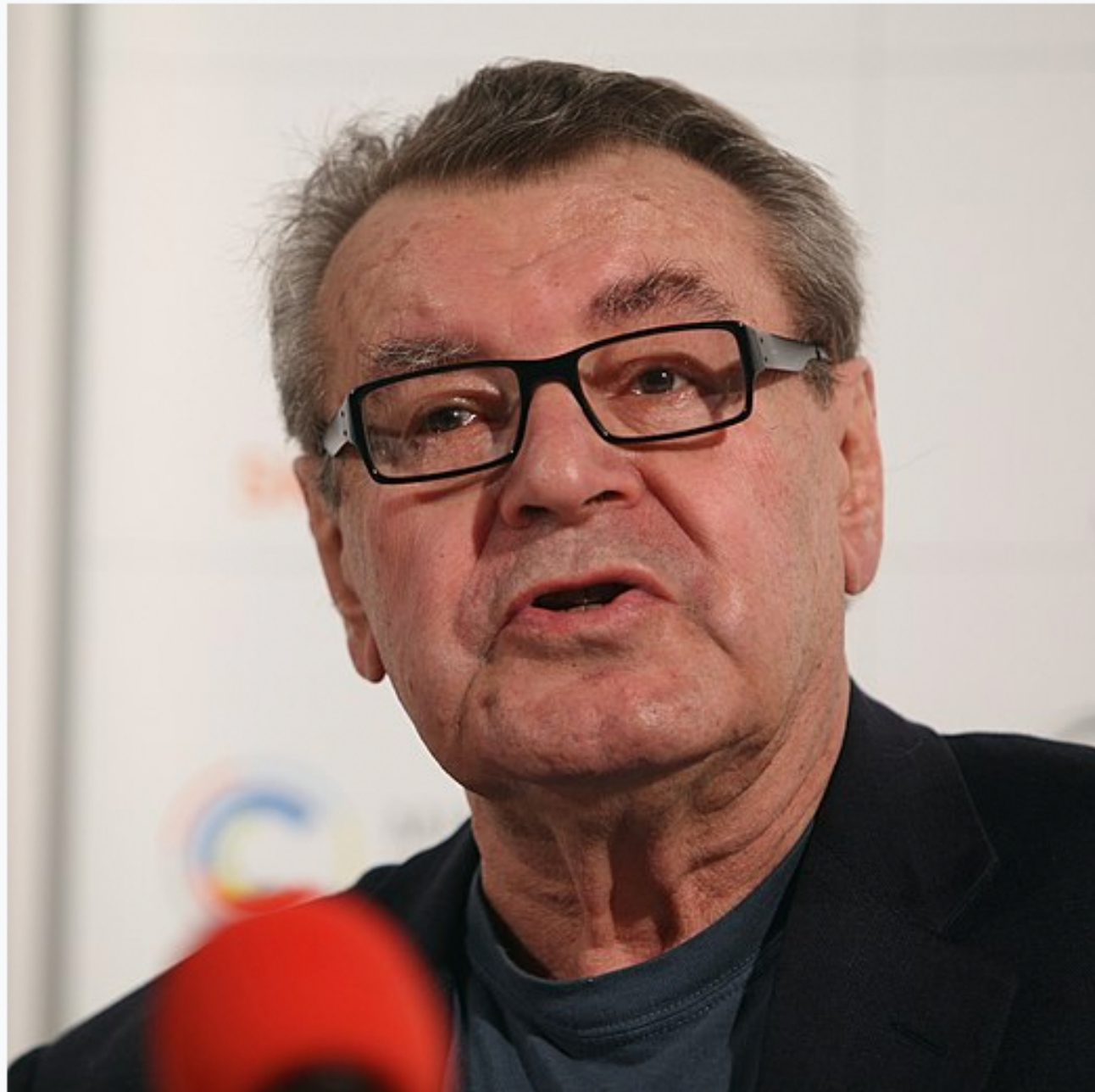
Miloš Forman na Mezinárodním filmovém festivalu v Karlových Varech (2009)