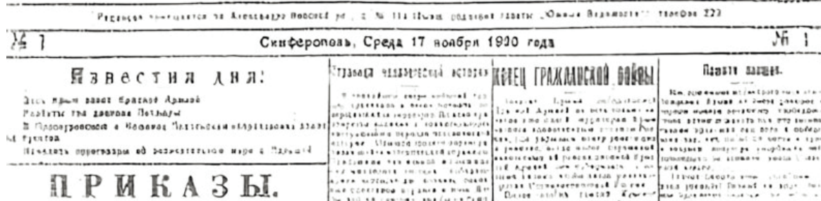
Перший номер газети «Красный Крым» («Червоний Крим»)

Орган Губернского Военно-Революционного Комитета и Крымского областного Комитета Российской Коммунистической партии.