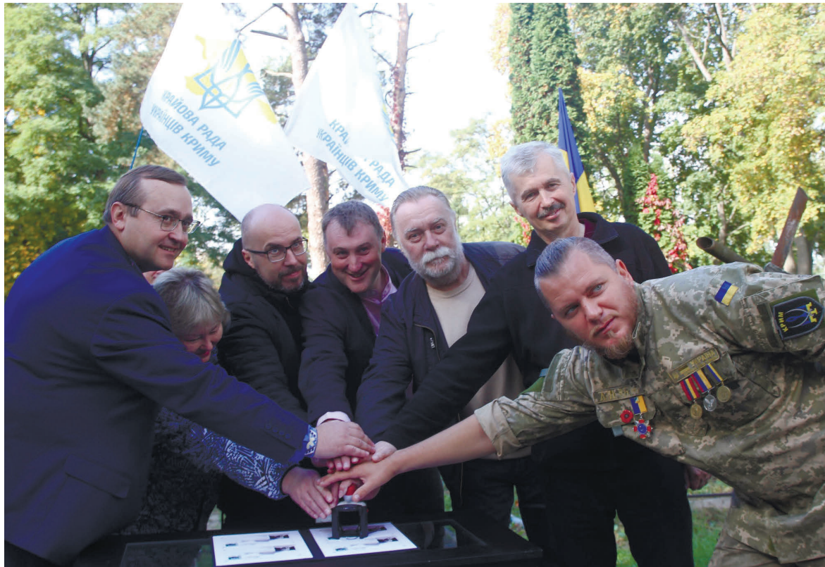
Символічним завершенням заходу стало спільне урочисте погашення його учасниками сувенірного конверта спеціальним штемпелем «Козацька пошта».

Ведучий заходу нагадав про співпрацю між Крайовою українською радою в Криму та крим-