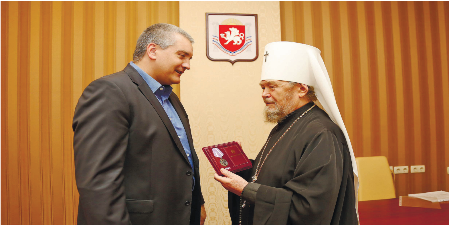
Митрополит Сімферопольський і Кримський УПЦ МП Лазар (Швець) отримує від «глави республіки Крим» Сергія Аксьонова «державну нагороду республіки Крим» – медаль «За звитяжну працю». Сімферополь, 11 липня 2015 р.