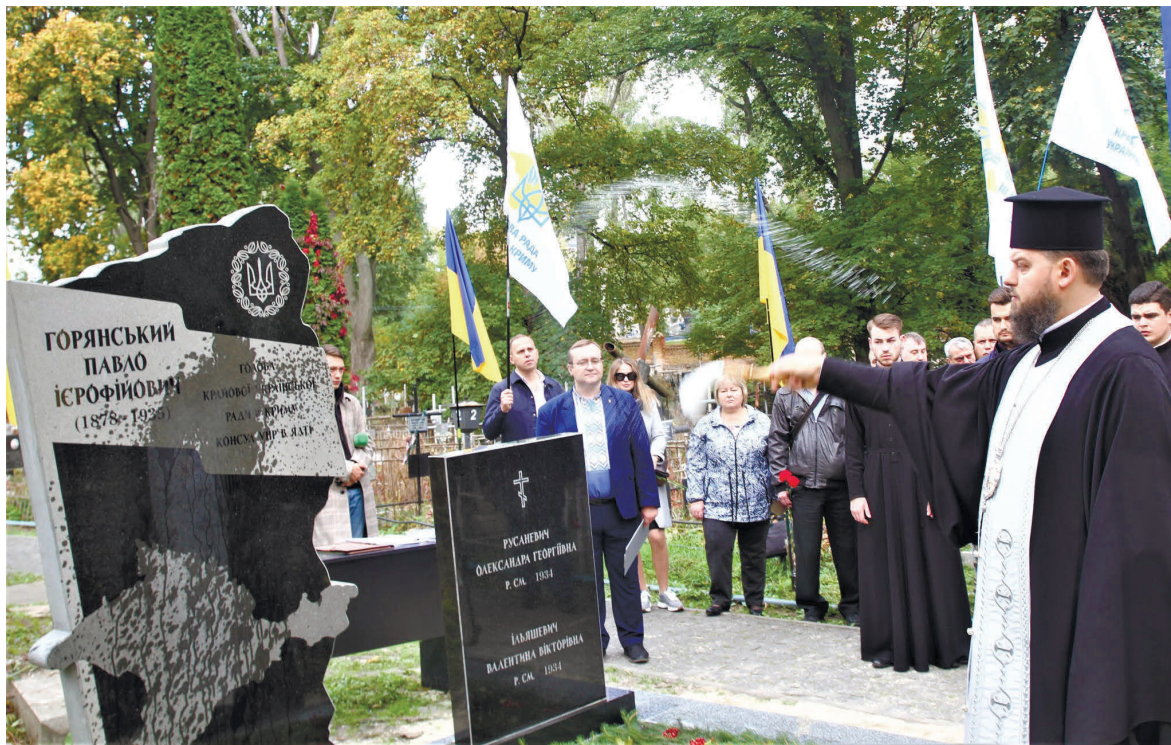
Вікарій Київської єпархії ПЦУ, намісник Свято-Михайлівського Золотоверхого монастиря, архієпископ Вишгородський Агапіт освячує пам'ятник.

«Відкриття й освячення пам'ятника Павлу Горянському – це знакова подія для громади кримських українців, яка є другою за чисельністю в Криму і перетворена окупантами на одну з двох найбільш дискримінованих етнічних спільнот на Кримському півострові», – переконаний