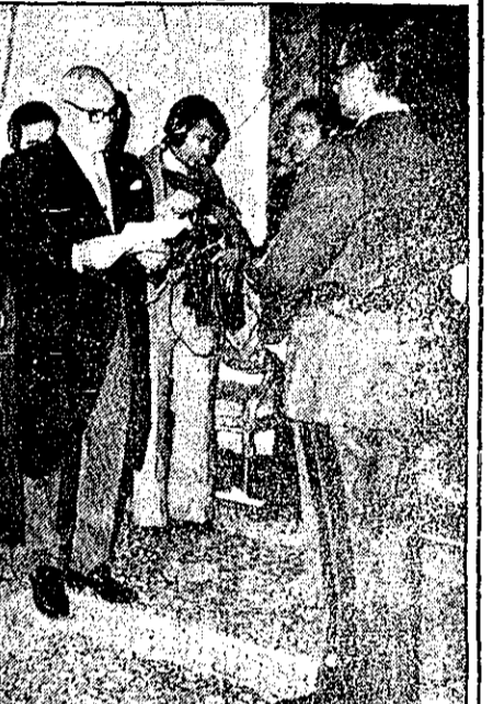
شاهنشاه: اگر برای وطن خطری پیش بیاید هیچ آرزویی امکان ندارد