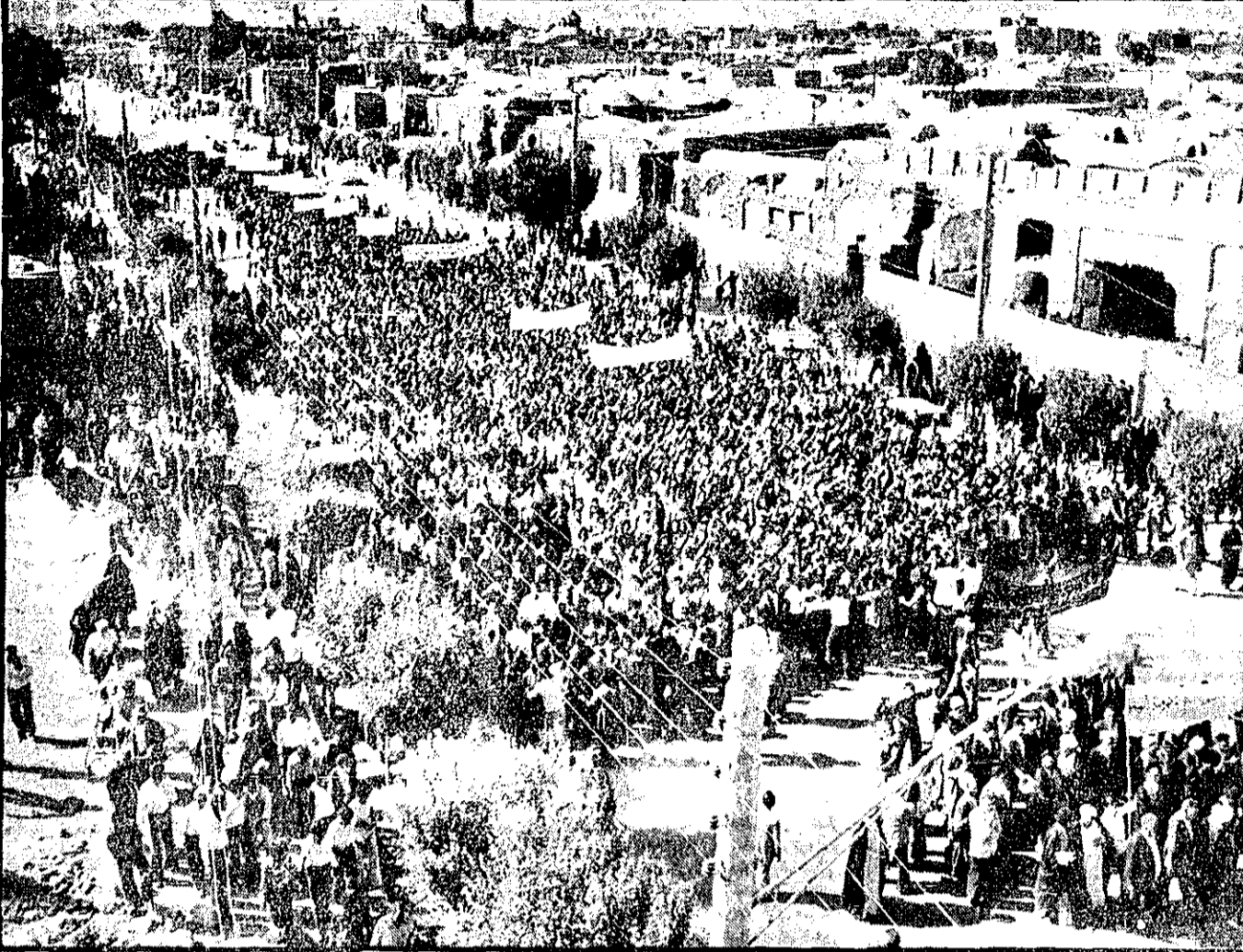
هزاران زن و مرد کرمانی دیروز در یکی از بزرگترین راهپیمایی‌ها شرکت کردند. عکس، گوشه‌ای از این راهپیمایی آرام را نشان میدهد

پیشاپیش جمعیت، از تظاهراتی که در پی جنبش آیت‌الله العظمی حاج شیخ علی‌اکبر صابری کرمانی و گروه دیگری بود، روحانیون و اربابان میدان، تاسیر و اطراف میدان آیت‌الله العظمی روح‌الله خمینی در دست عده‌ای از راهپیمایان کرمانی دیده می‌شد. دیروز علاوه بر مردم شهر کرمان، عده زیادی از روستاهای