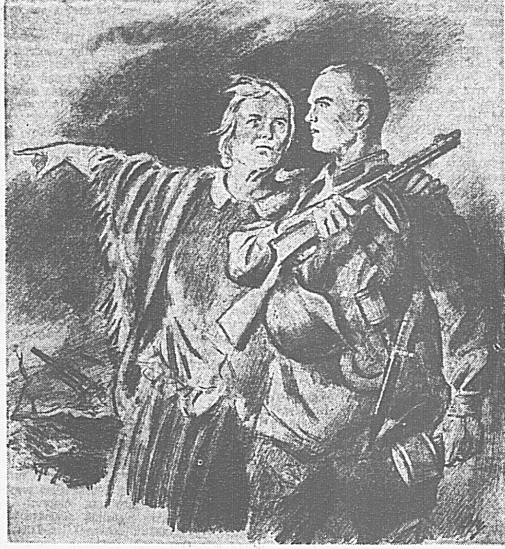
Рис. В. Шенгелова.

Неслыханные зверства по отношению к мирному населению всегда являлись отличительной чертой германской армии. В войне 1914—1918 гг. немецкие солдаты и офицеры с необыкновенной жестокостью истребляли не в чем не повинных женщин, детей и стариков. История сохранила на своих страницах рассказ о страшной судьбе мирного польского городка Калши, который стал жертвой немцев в первые дни войны. Завладев этот городок, немцы устроили страшную расправу над мирными жителями. Командант Калши майор Р. Прейкер издал приказ, в котором было сказано: «Я запрещаю выезды из города и объявляю недействительность пропусков. Всякое пребывание на улицах и площадях воспрещается. Остановки вообще не разрешаются, ослушание военных приказов карается смертью». Вскоре в городе начались повальные расстрелы, убийства и грабежи. Калши стал городом-кладбищем. Но бесчеловечные расправы армии Вальтера с мирными жителями бледнеют перед зверской, тупой жестокостью фашистов. Их путь отмечен потоками крови и лавинами пожарищ. Гитлер твердит о необходимости физически уничтожить народы, с которыми воюет Германия. Свободолюбивое человечество никогда не простит немецкой армии ее злодейский расправ с беззащитными женщинами, стариками, детьми. Детоубийцам нет и не будет пощады! На снимках: слева — в бельгийском городке, где побывали немцы в 1914 году. Справа — в украинской деревне, где побывали немцы в 1942 году.