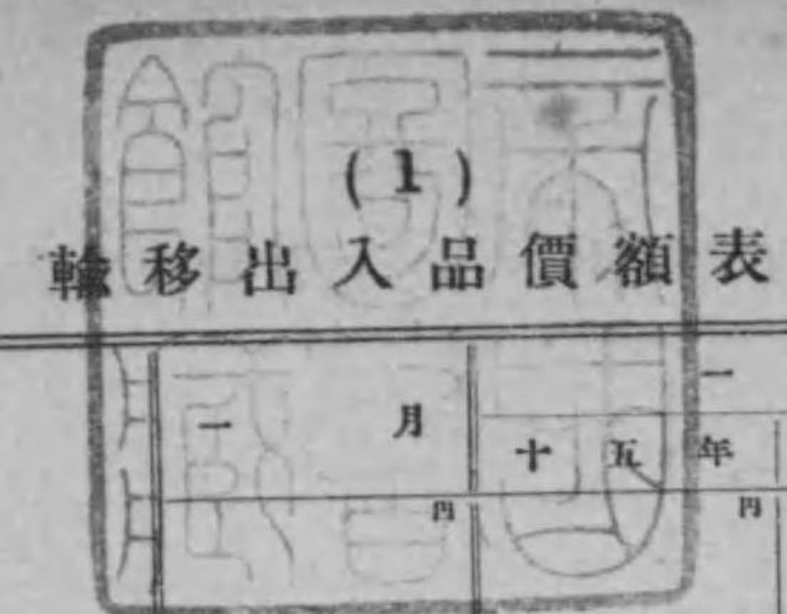
(1) 輸移出入品價額表