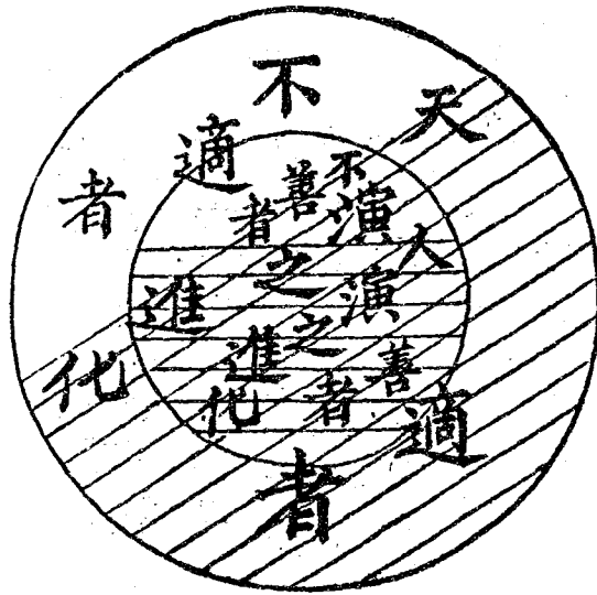
理想的天人共演 (第三圖)