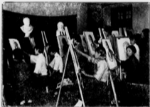
習 實 畫 洋 西