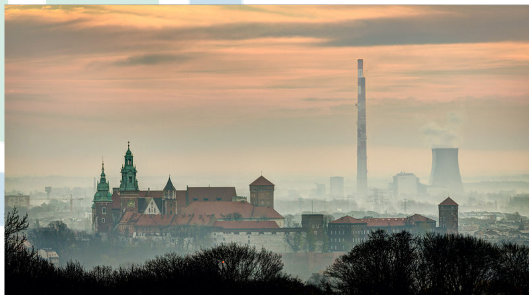
Zdobywca I miejsca 2013, Wawel i Łęg.