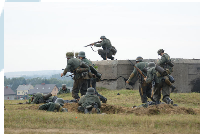
• Rekonstrukcja bitwy pod Mławą, Adam Kliczek, CC-BY-SA-3.0 Michał Buczyński, Wikimedia Polska

Stowarzyszenie i Komisja czekają na nowe dobre projekty.