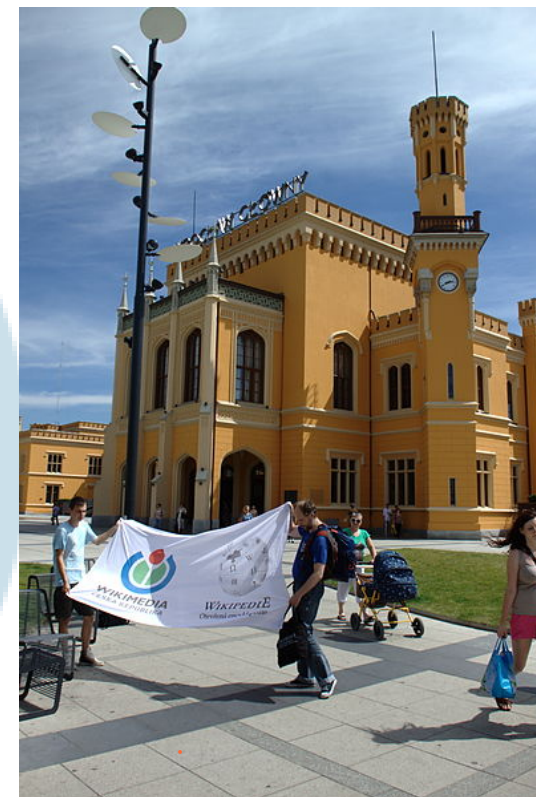
Start wikiekspedycji we Wrocławiu

Budżet: łącznie max 70.000 PLN + 2.600 PLN (rachunki schodzą)