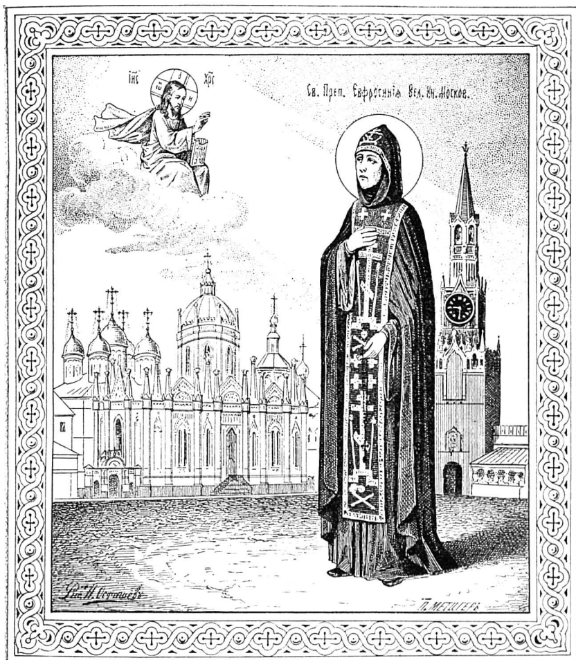
Великая княгиня Евдокія, во иночествѣ Преподобная Евфросинія, основательница Вознесенскаго дѣвичьяго монастыря.