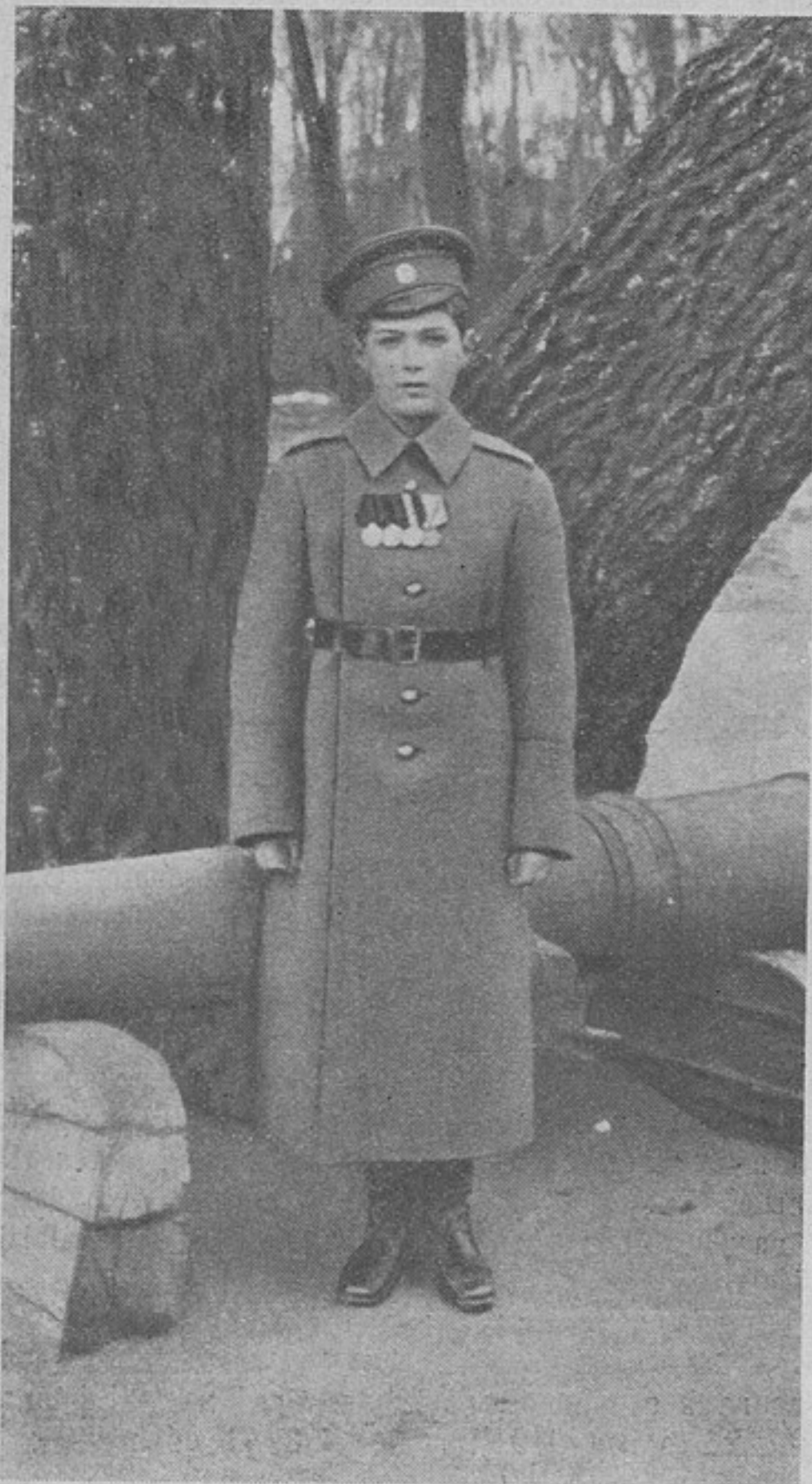
Его Императорское Высочество НАСЛѢДНИКЪ ЦЕСАРЕВИЧЪ и Великій Князь АЛЕКСѢЙ НИКОЛАЕВИЧЪ.

СОДЕРЖАНИЕ: Распоряженія по военному вѣдомству. — Изъ приказа главнокомандующаго арміями — фронта. — Хроника. — Война. — Работа въ Балтійскомъ морѣ. Статья Р. Киплина. — О Высочайшемъ благоволеніи. Ж. — Къ вопросу о производствѣ подполковниковъ кадетскихъ корпусовъ. ** — Сраженіе на рѣкѣ Соммѣ. А. — Награды георгіевскимъ кавалерамъ. — Свѣдѣнія объ убитыхъ и раненыхъ. — Вопросы и отвѣты. — Почтовый ящикъ. — Объявленія.