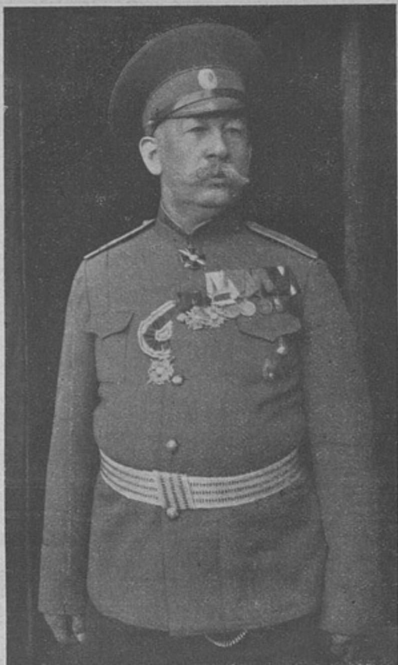
Подполковникъ Броневскій, убитъ въ бою.

безуспѣшно и, потерявъ 6 офицеровъ и свыше 200 чел. нижнихъ чиновъ плѣнными, должны были поспѣшно отступить.