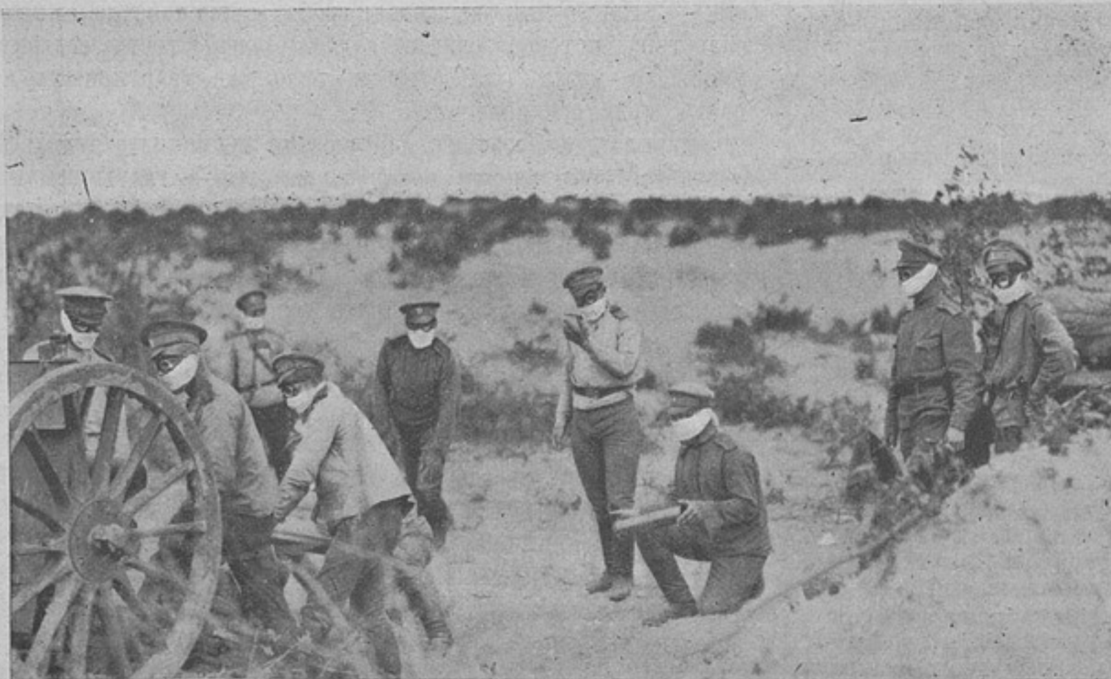
Подъ Черновцами. Работа нашихъ артиллеристовъ, снабженныхъ противгазами.

23-го іюля. Къ югу отъ Бродъ, на рѣкахъ Граберкѣ и Серетѣ, весь день шли упорные бои изъ-за деревень и