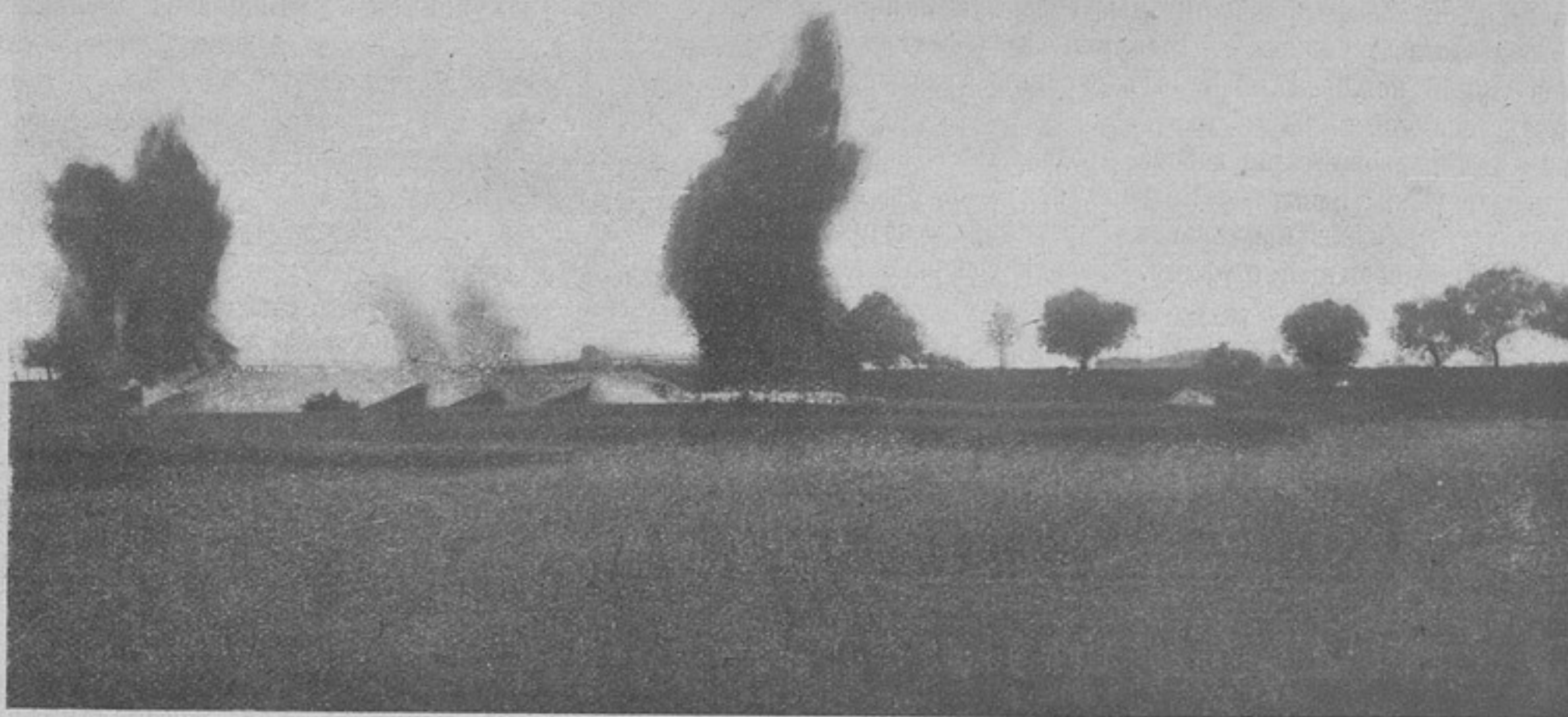
Взрывъ австрійцами мостовъ на Стоходъ во время отступленія.

Переправившись на правый берегъ и отбѣсивъ противника, наши части захватили рядъ высотъ въ районѣ къ западу отъ Велеснюва и въ направленіи на югъ до моста на Днѣстрѣ на желѣзной дорогѣ Нижніувъ—Монастержиска. Противникъ произвелъ здѣсь двѣ контръ-атаки, которыя нами отражены, причемъ мы сами, перейдя въ наступленіе, захватили плѣнными 5 офицеровъ и 414 нижнихъ чиновъ, пулеметы и одно орудіе.