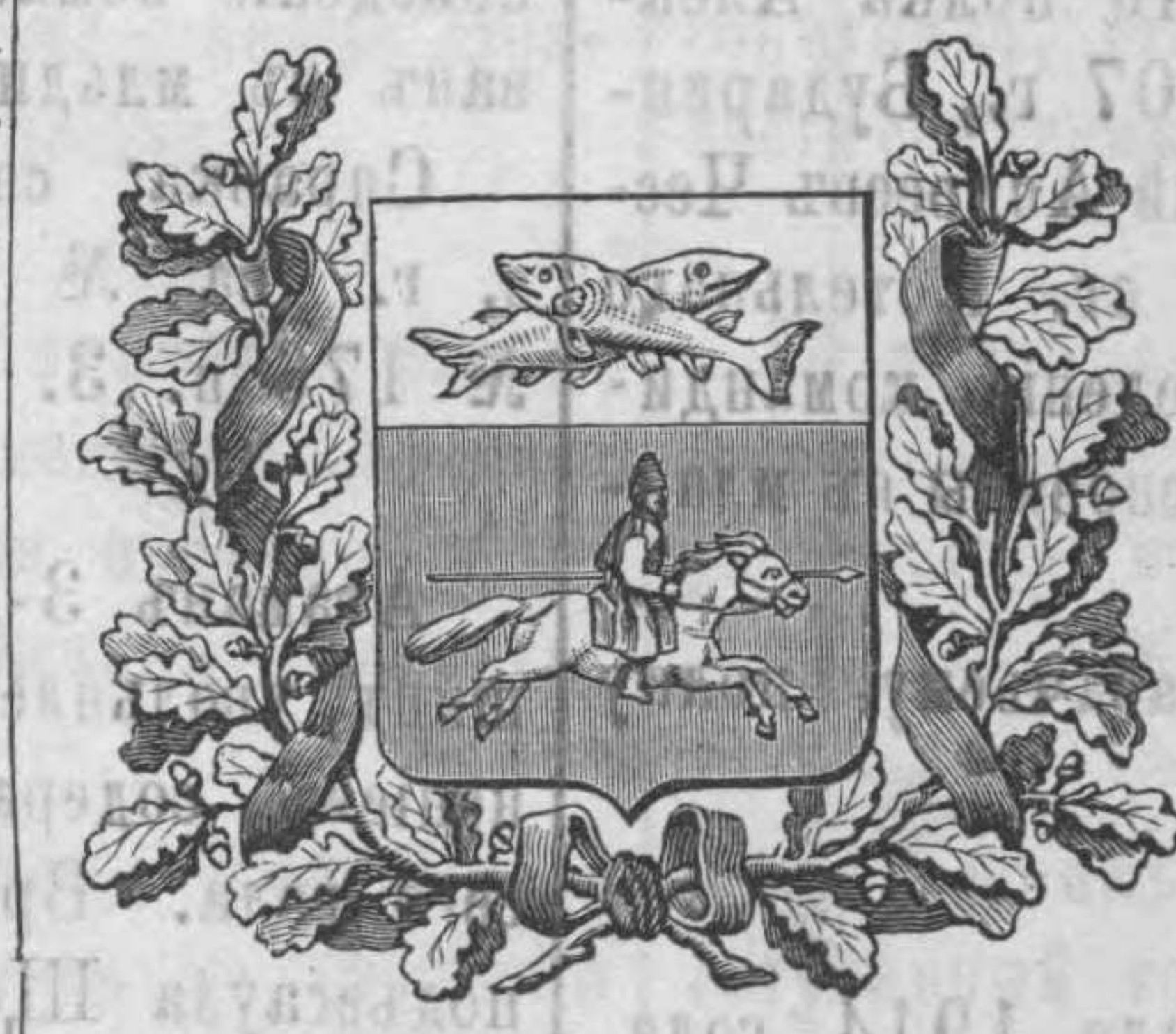
№№ ВЪ ГОДЪ.