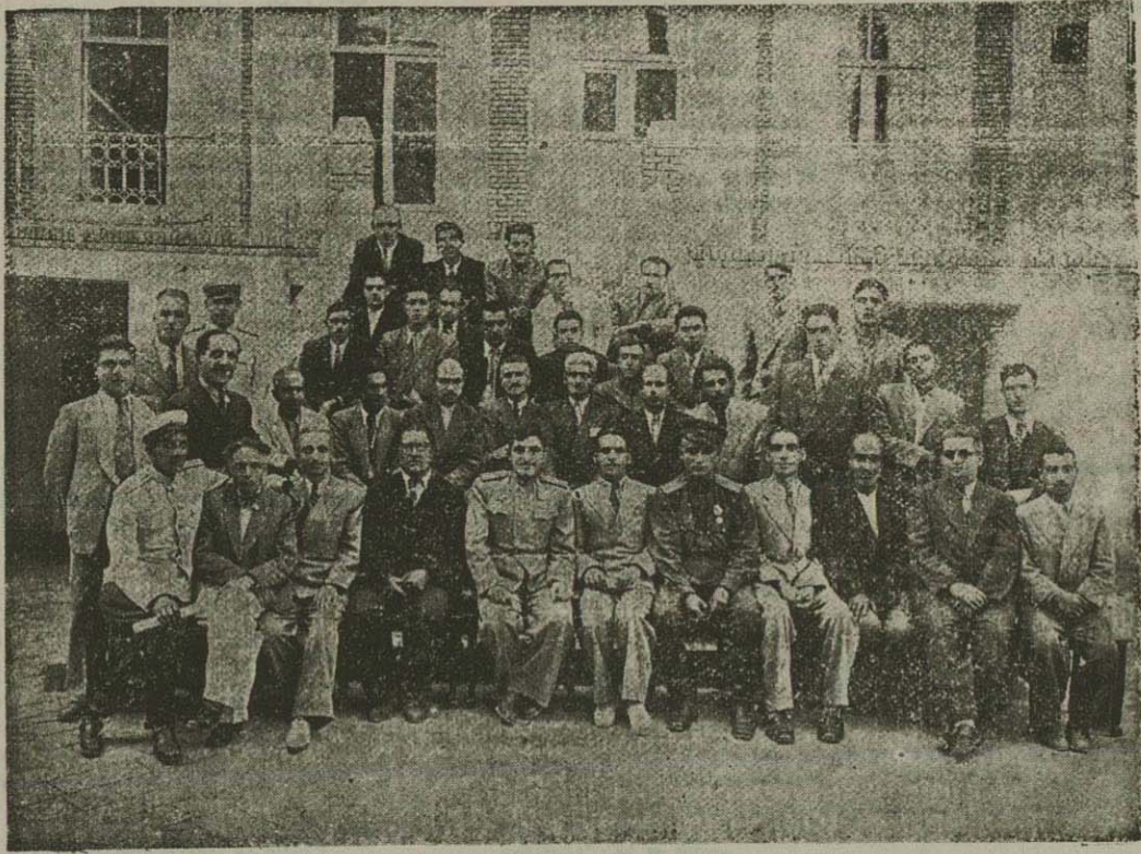
شعراي آذربایجان ایران و آذربایجان شوروی در کنار یکدیگر

نقابه: «انحطالی پناهیان» خبر گکار مخصوص روزنامه اطلاعات