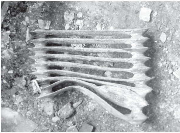
Пожежно-рятувальна служба Макарівського району ГУ МНС України в Київській області.

Шановні громадяни! Щоб не сталося лиха, ще раз звертаємось до вас: дотримуйтесь елементарних правил пожежної безпеки, будьте обережні в поводженні з вогнем, адже від таких прописних істин залежить ваше життя та життя ваших дітей.