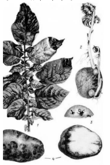
Фітофтороз картоплі: 1 - уражений лист; 2 - уражена листовка; 3 - уражений відрізок; 4 - зрілі уражені бульби, праворуч — те саме в розрізі

Дотримання і виконання вказаних рекомендацій збереже ваші бульби від фітофторозу та забезпе-