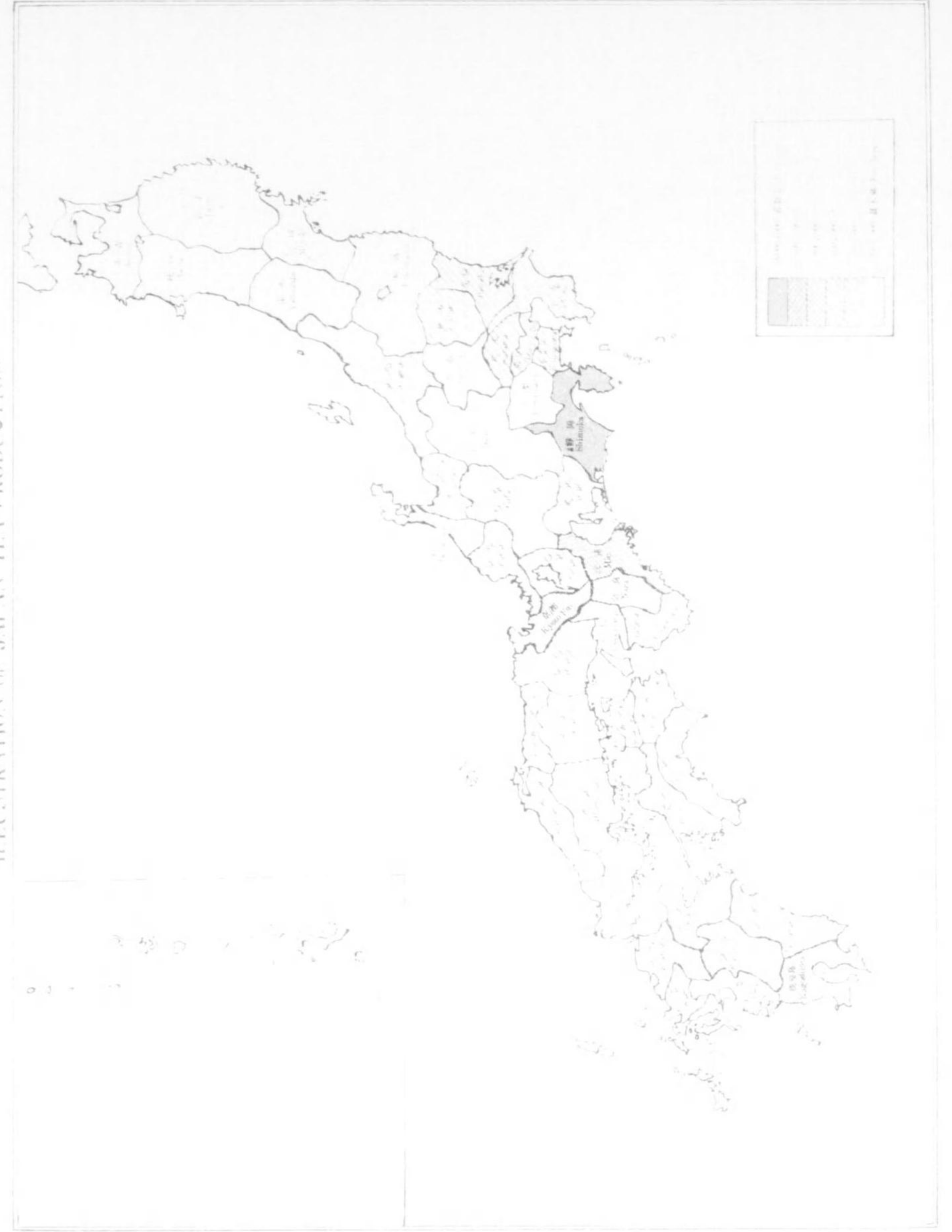
日本茶生産圖表 ILLUSTRATION OF JAPAN TEA PRODUCTION

(A is also arranged by the above 12 letters)