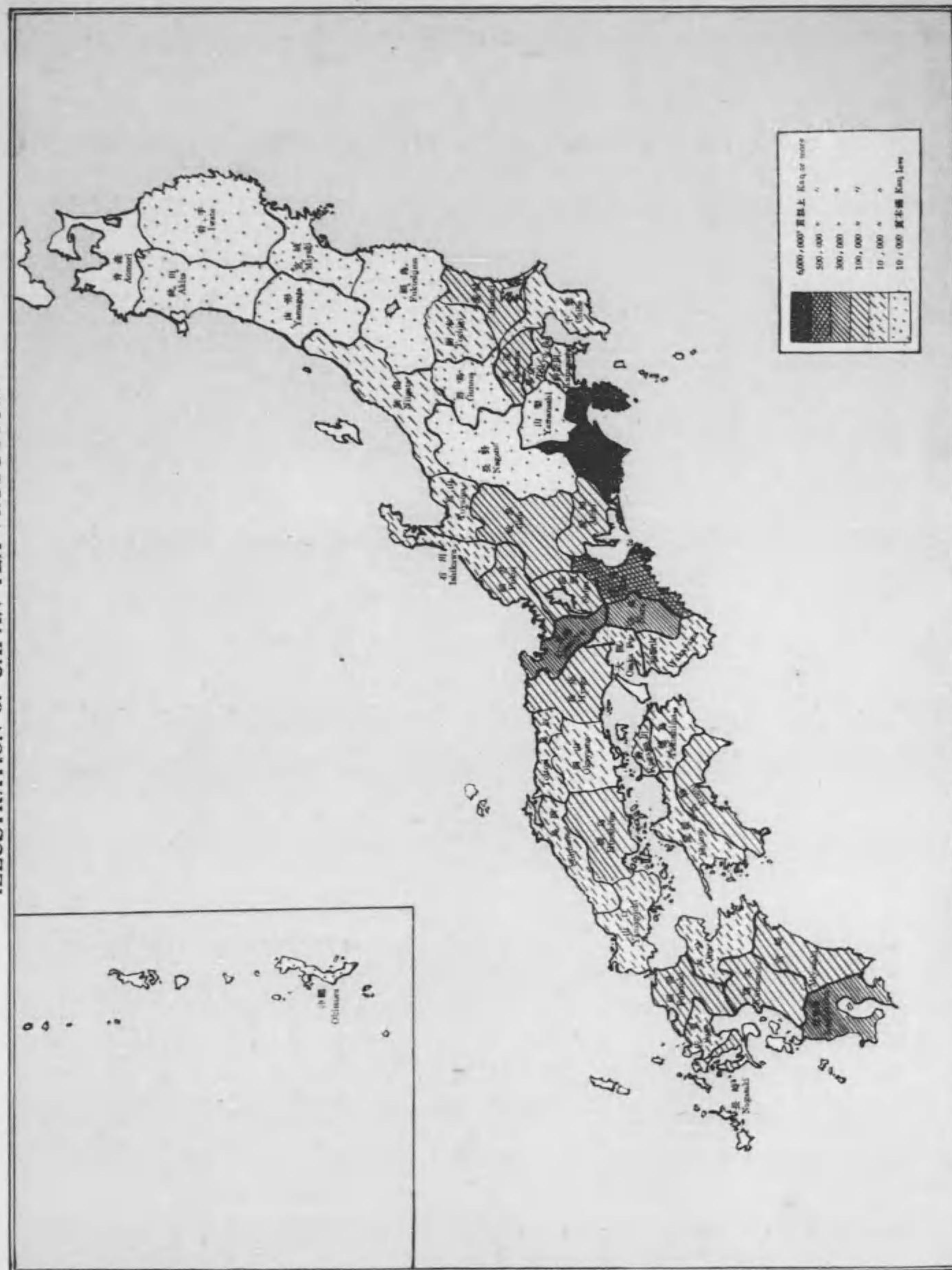
日本茶生産圖表 ILLUSTRATION OF JAPAN TEA PRODUCTION