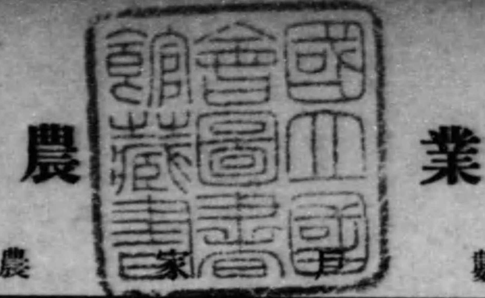
第 1 表 農 業 數